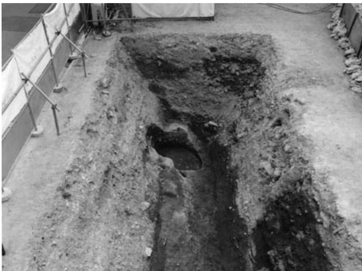
2 1区第2面全景・堀状遺構SX 8（北から）