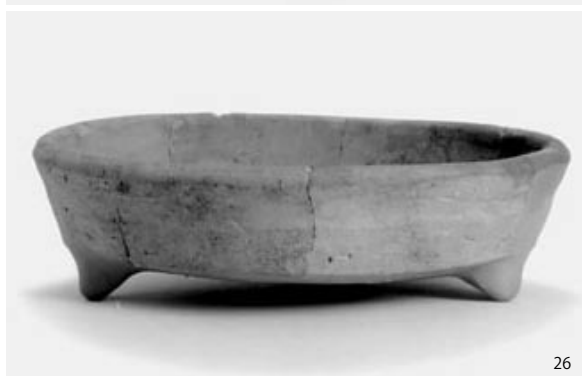
1区 SX 8 · 2区 SX82 出土土器