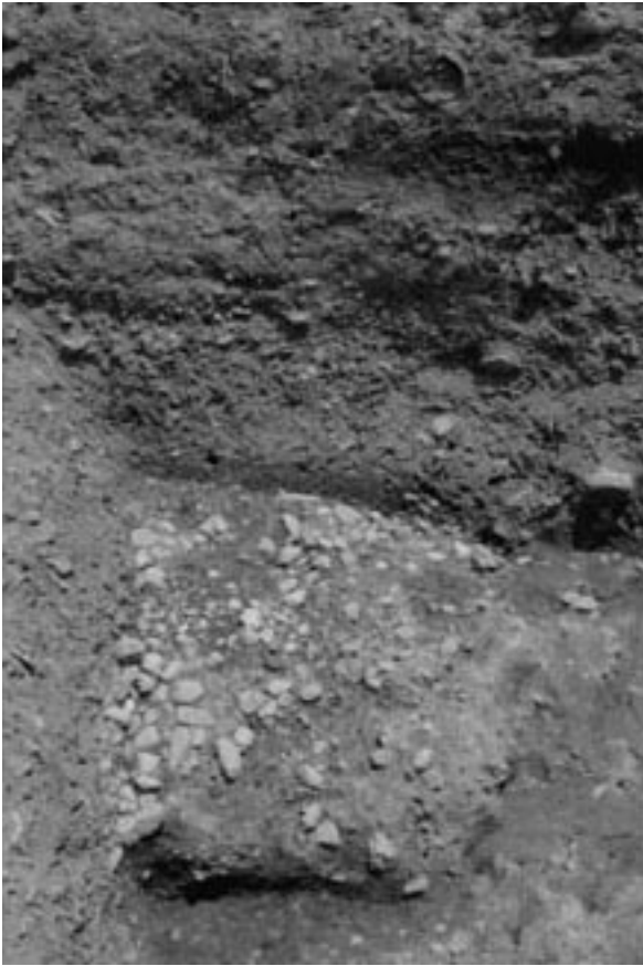
1 1区路面状遺構 14 (西から)