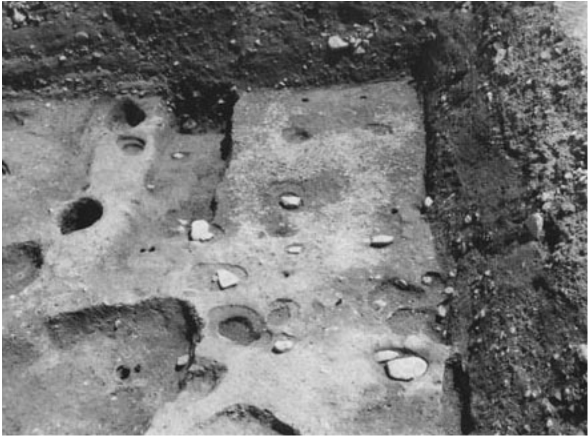
1 2区柵 SA003A・B (西から)