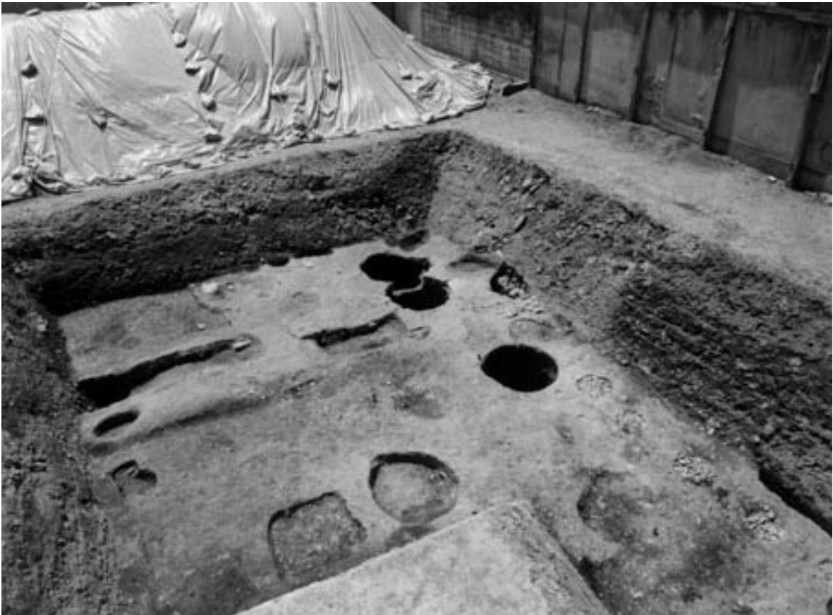
3 2区第1面全景 (北東から)