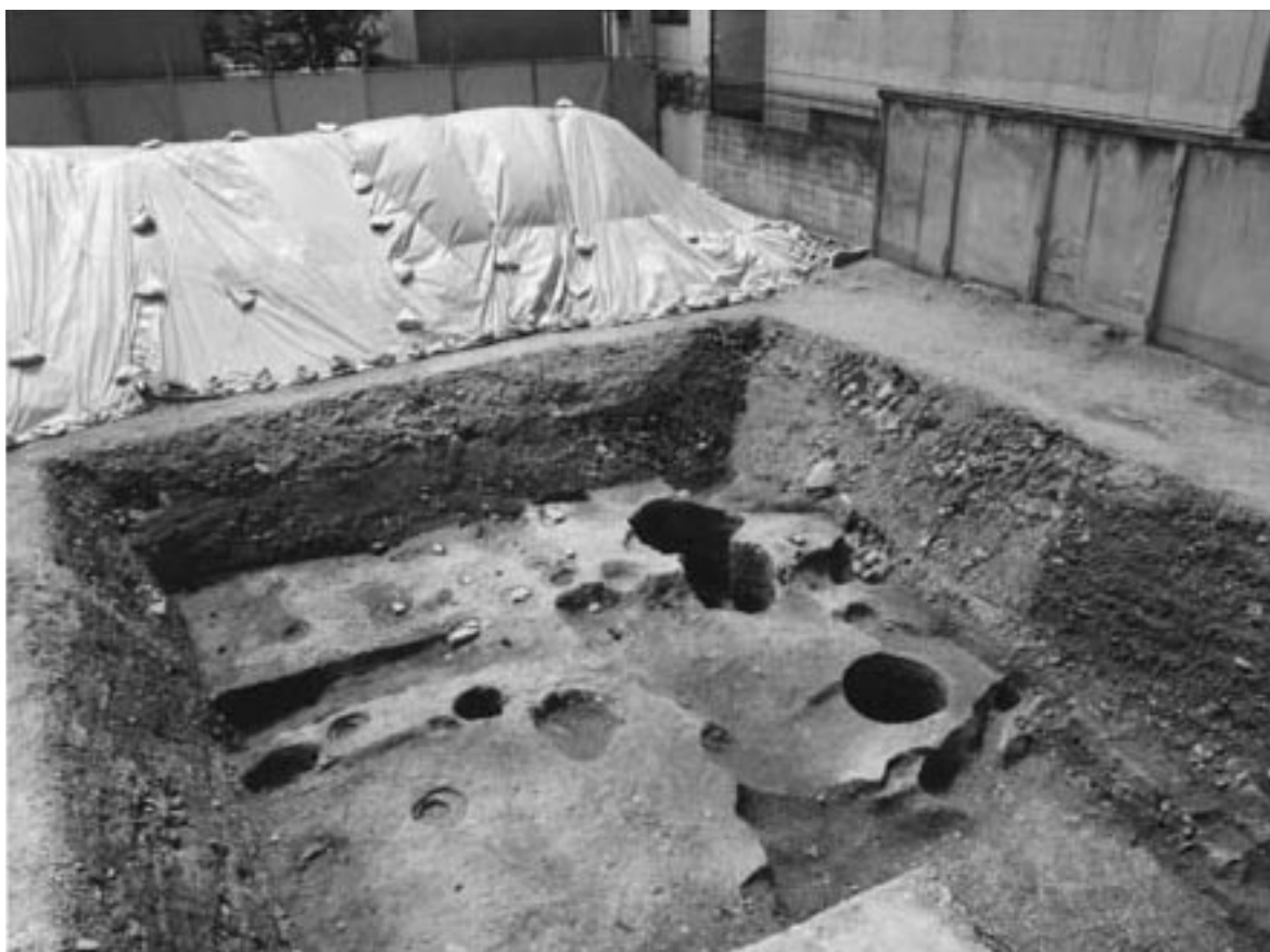
1 2区第2面全景（北東から）