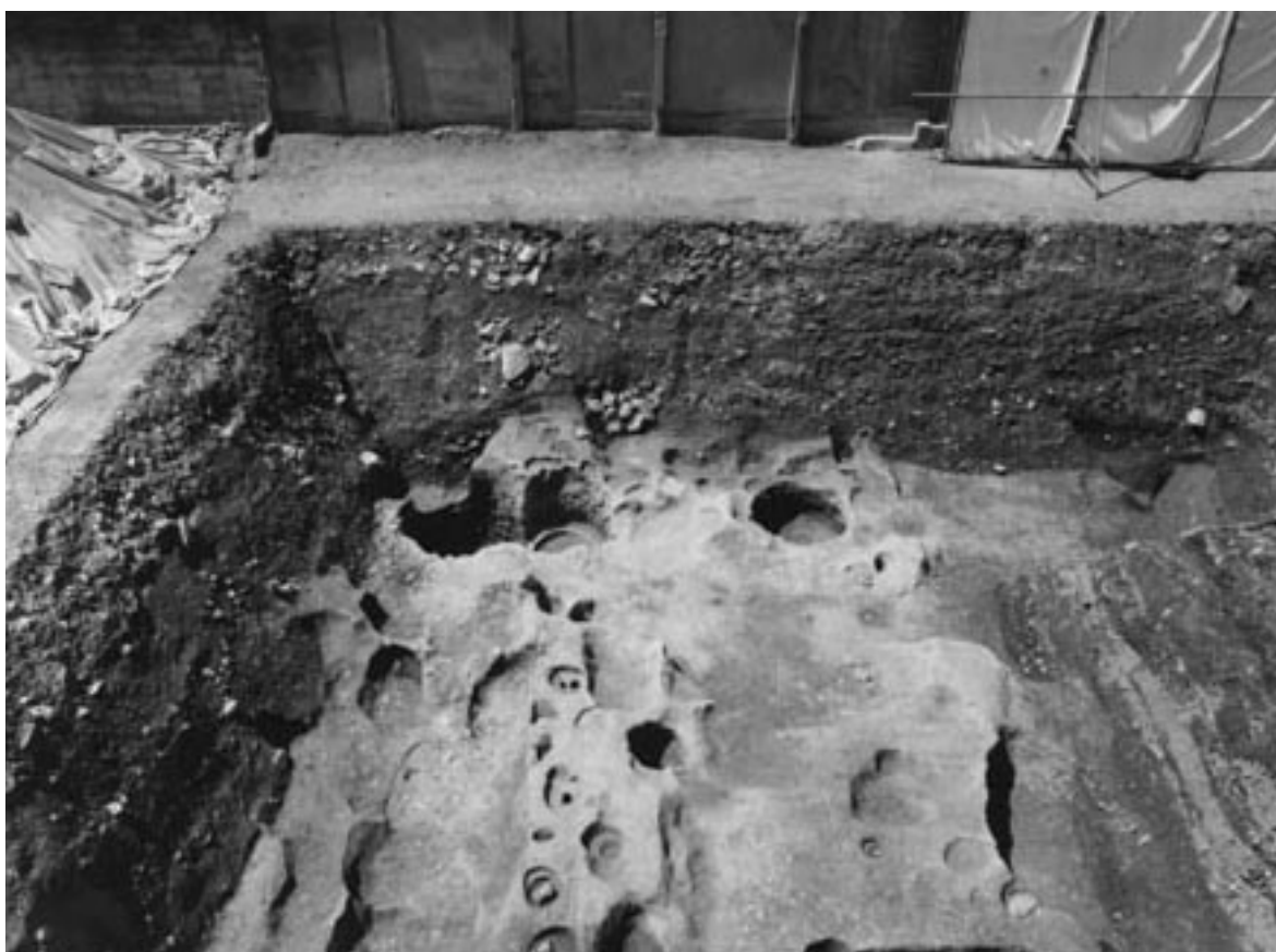
2 2区第3面全景（東から）