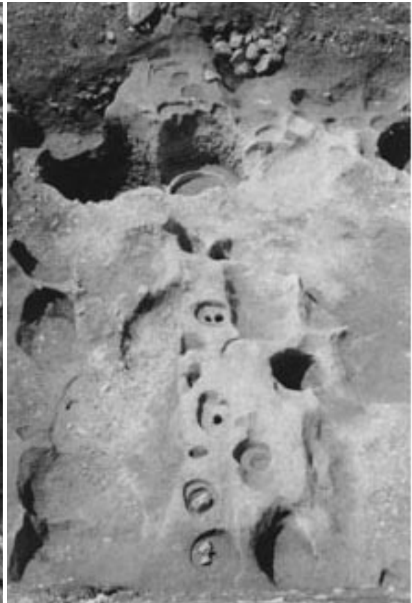
3 2区柵 SA004 (東から)