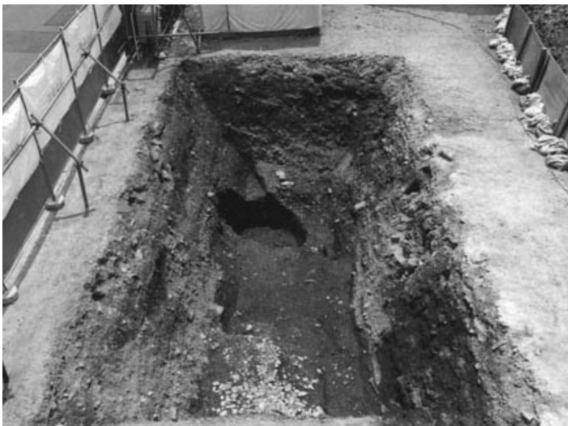
1 1区第1面全景（北から）