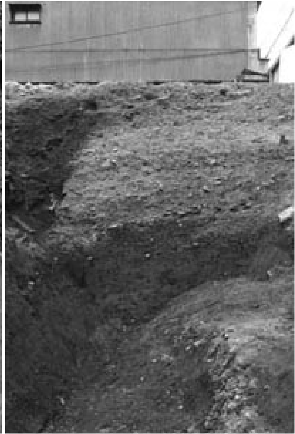
2 1区堀状遺構 SX 8北壁 (南から)