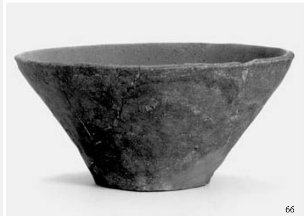
2区 SX10 出土土器