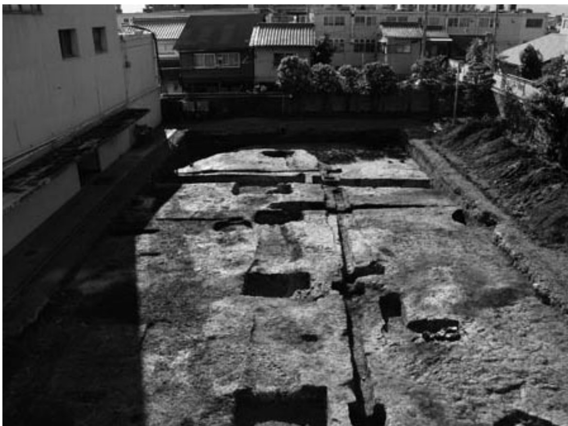
1 調査区全景 平安時代から江戸時代（東から）