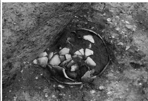
4 土坑19 土器出土状況（北西から）