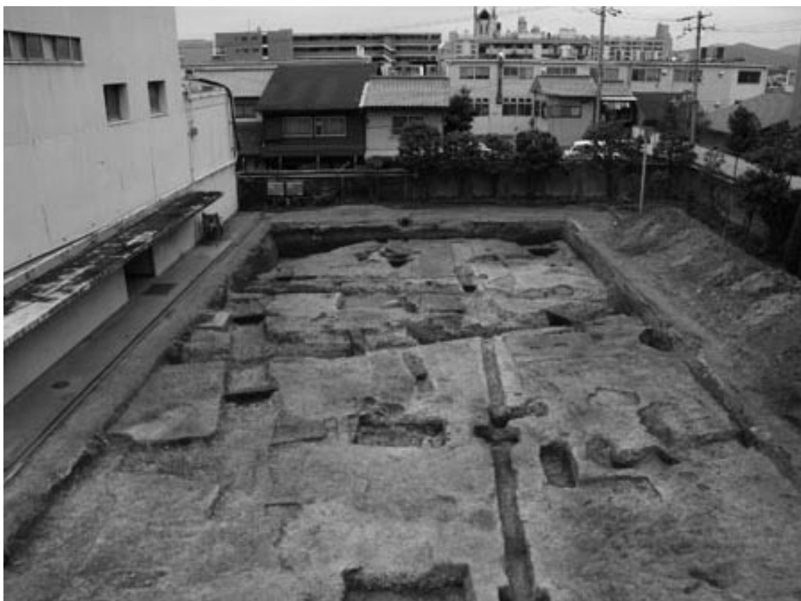
1 調査区全景 弥生時代から古墳時代（東から）