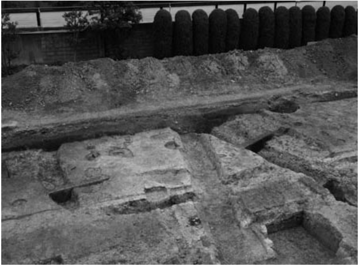
1 方形周溝墓2（南西から）