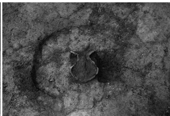
3 土坑5 土器出土状況（南東から）