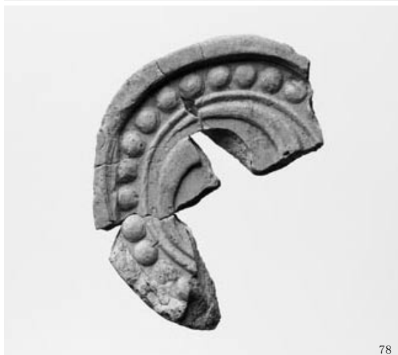
土師器・須恵器・軒丸瓦