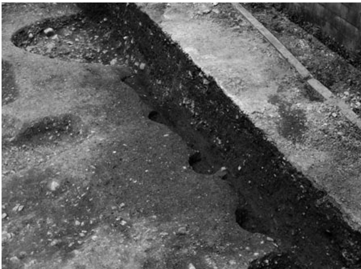
2 柱穴列（柱穴 39～42・47、北西から）