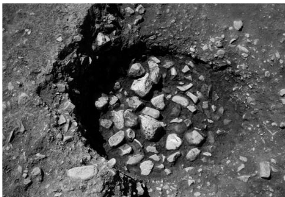
1 土坑12 (北から)