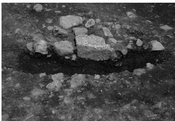
4 柱穴46断面 (西から)