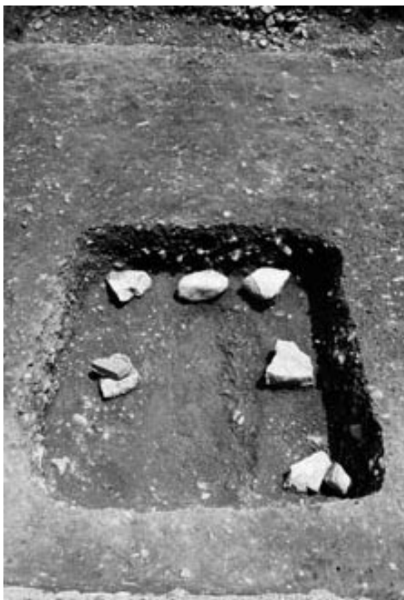
5 土坑23 (西から)