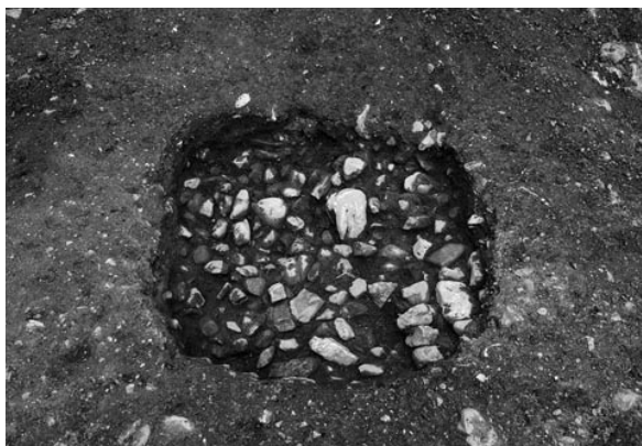
2 土坑5 (北から)