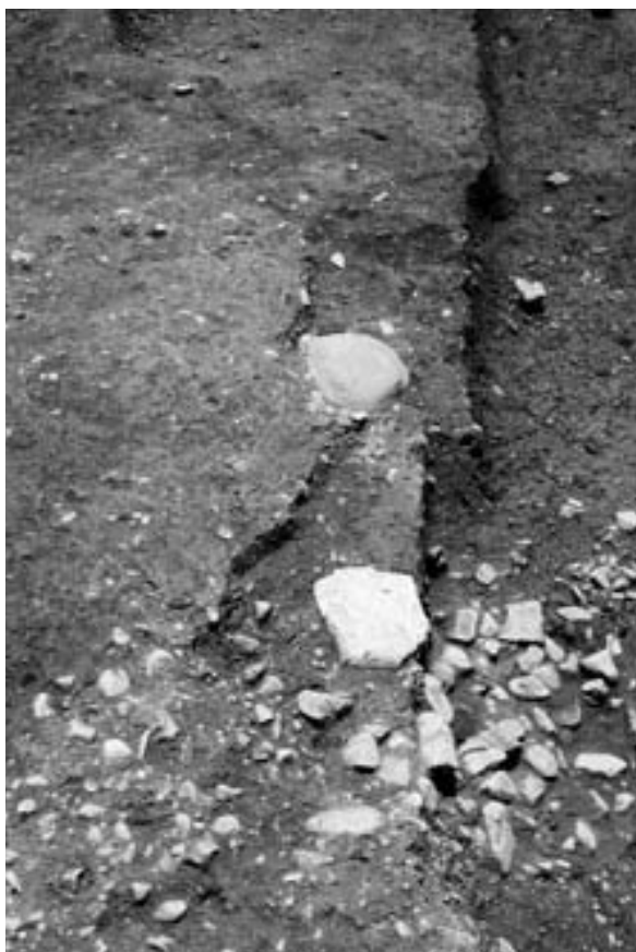
6 礎石列 (柱穴43・44、北から)