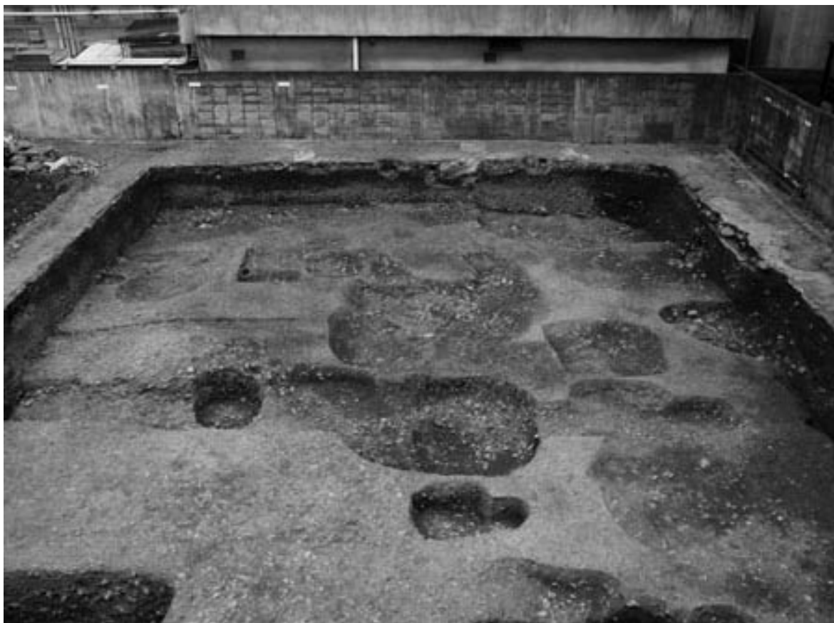
1 調査区全景（西から）