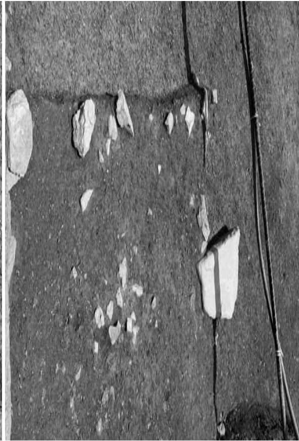
2 石列 55・礎石 2 (北から)