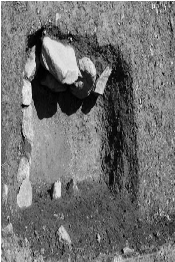
1 石組遺構 49 (東から)