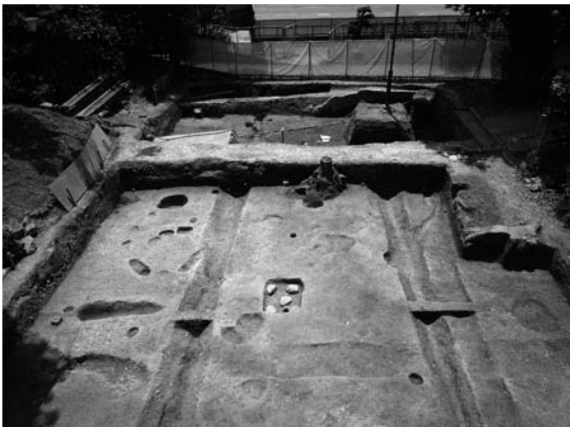
1 調査区全景（北から）