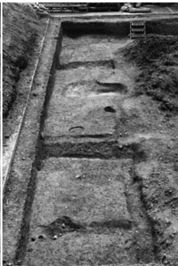
3 反転部北区北端（西から）