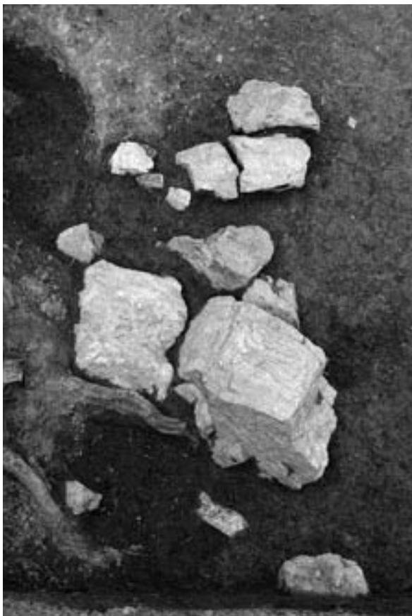
3 集石 54 (南から)