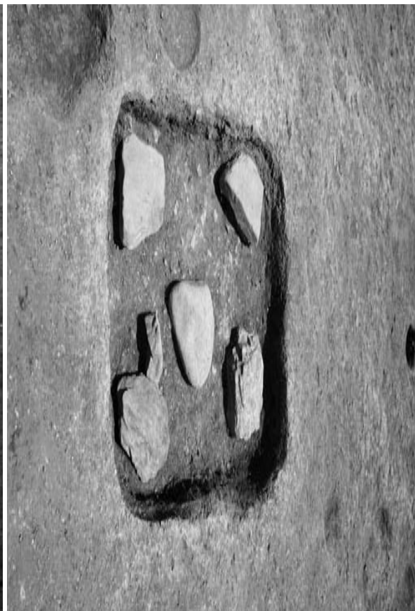
4 土坑 10 (北から)