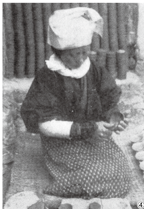
図2 土器製作状況（島田貞彦「山城幡枝の土器」『考古学雑誌』21巻3号 1931年より一部改変して転載）