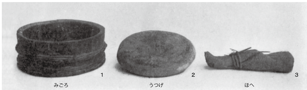
図1 土器作成年具（島田貞彦「山城幡枝の土器」『考古学雑誌』21巻3号 1931年より一部改変して転載）