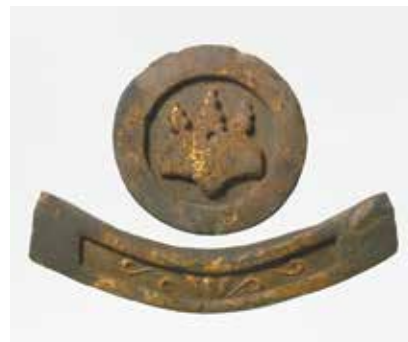
写真2 桐文軒丸瓦・軒平瓦