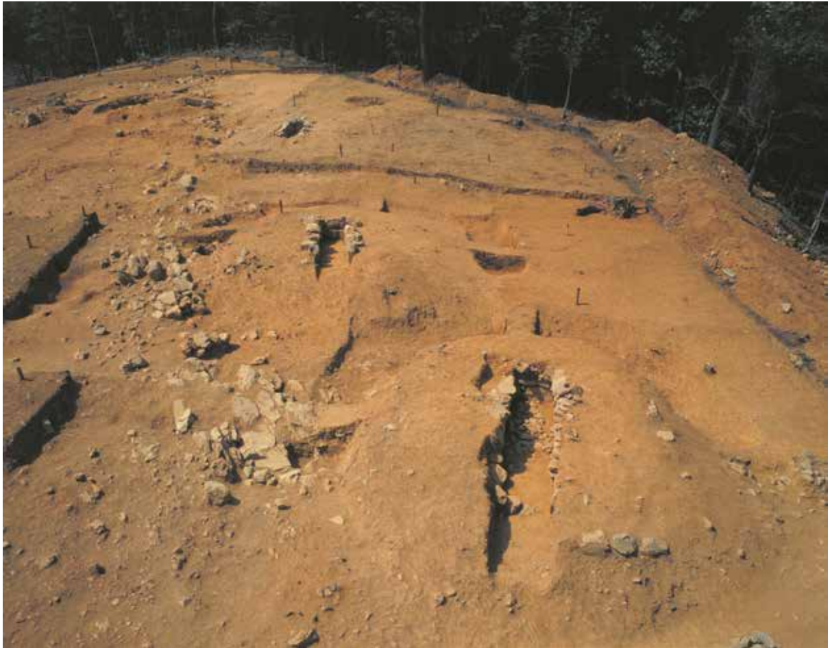
旭山古墳群D支群 (南から)

7世紀初めから中頃にかけての時期は、一般的に畿内のほとんどの地域で古墳時代後期を特徴づける群集墳の築造が停止され、わずかに追葬がなされるのみになる。つまり、この時期が古墳時代の終末期である。東山の地にはこの終末期に新たに墓域を得て造営を開始する旭山古墳群がある。