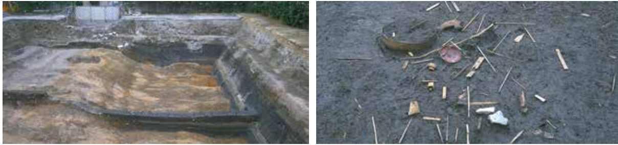
5 平安京左京九条二坊 南区九条鳥居口町 秀吉が造った御土居 (左)。さまざまな生活用品を堀に捨てた (右)。桃山～江戸時代