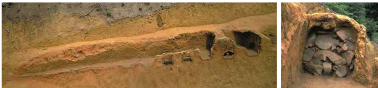
9 岩倉上蔵町炭焼窯跡 左京区岩倉上蔵町 木炭を焼いた窯 (左)。窯の奥壁 (右)。奈良時代