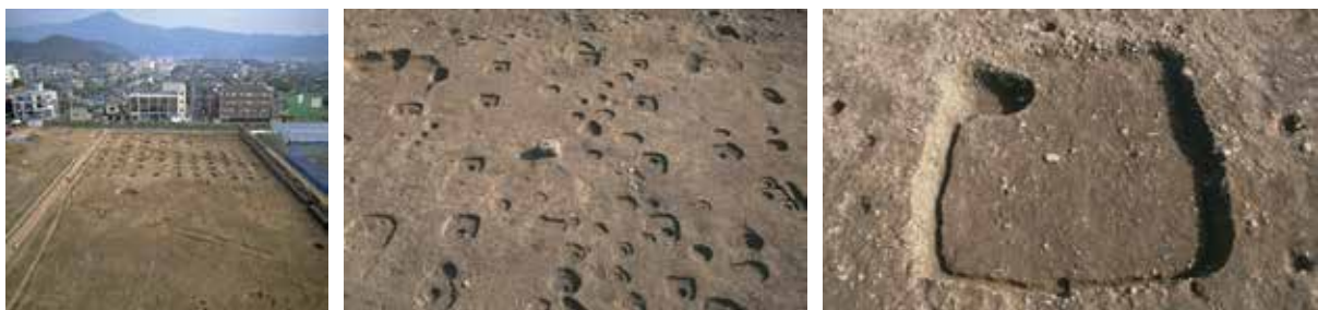
8 植物園北遺跡 左京区下鴨半木町 集落が南にも広がるのがわかった (左)。建物跡 (中) と縦穴住居跡 (右)。奈良時代