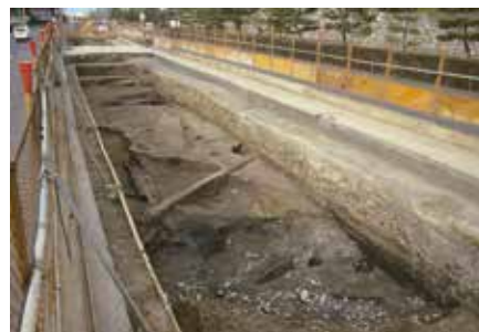
2 平安京左京三条一・二坊 中京区押小路通堀川西入 地下鉄東西線の調査（左）。神泉苑の池への溝（右）と舟着場（中）。平安～江戸時代