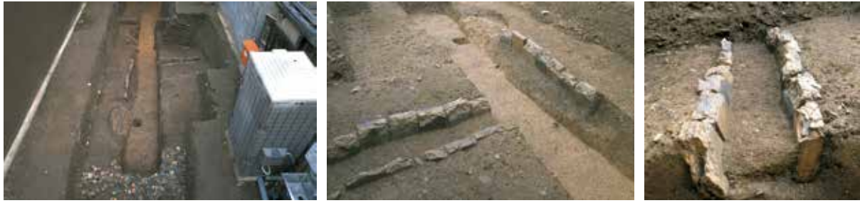
4 平安宮中務省跡 上京区土屋町通丸太町上る中務町 中務省の北西の角 (左)。西築地 (中) と塙を利用した溝 (右)。平安時代前期