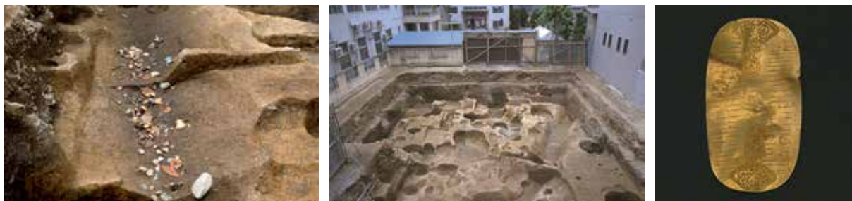
6 平安京左京五条三坊 下京区室町通綾小路上る鶏鉾町 平安京跡下層の溝 (左・中) 出土した小判 (右)。弥生～古墳時代・江戸時代