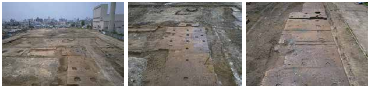
7 平安京右京六条一坊 下京区中堂寺栗田町 ガスタンクの下に残った邸宅跡 (左)。建物跡 (中・右)。平安時代