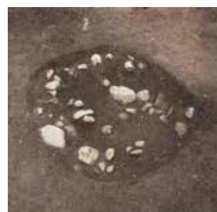
1 北白川上終町遺跡 左京区北白川山田町 北白川の縄文のムラ（左）。京都市内最古の竪穴住居跡（中）と集石遺構（右）。縄文時代早期