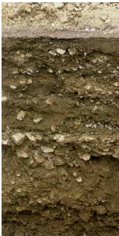
立会調査で発見された路面跡

5世紀後半以後、後に蜂岡寺（広陸寺）の建立される太秦蜂ヶ岡を囲むように6基の大きな前方後円墳や双ヶ岡一ノ丘頂上の大円墳が相次いで造られる。これとやや築造時期を遅らせながら嵯峨野台地にも中規模な円墳や方墳が姿を現わし始める。6世紀後半から7世紀前半に至ると、嵯峨野北部の山