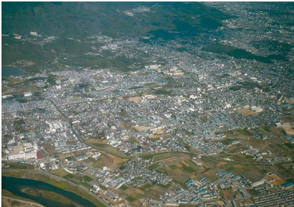
南西上空からみた太秦・嵯峨野 右手奥の丘陵が双ヶ岡、左手前は桂川。

京都の西郊、右京区太秦・嵯峨野地域では、近年になって新たな遺跡が数多く発見されている。これは主として広域下水道整備事業による掘削工事が右京区一帯で実施され、工事にともなう立会調査が進められていることによる。新発見の遺跡には、集落・寺院・邸宅・古墳・古墓・瓦窯など多岐にわたっている。これらのうち注目すべき遺構に路面がある。