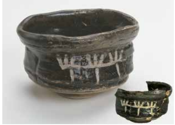
黒織部沓茶碗 (中京区烏丸通竹屋町下る少将井町出土)