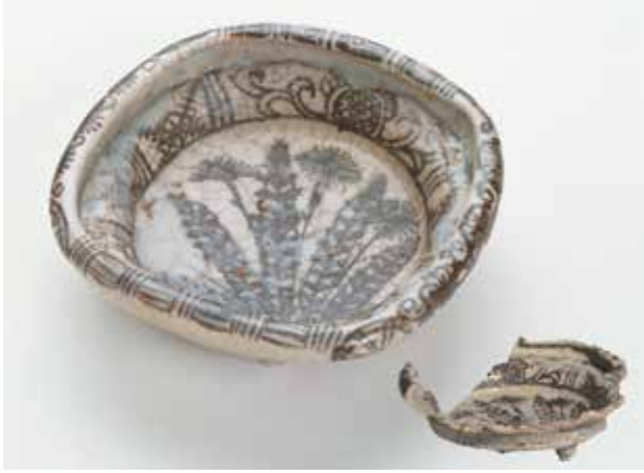
志野向付 (上京区室町通樺木町下る大門町出土)