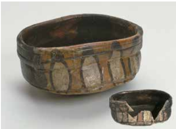
織部沓茶碗 (中京区烏丸通二条下る秋野々町出土)