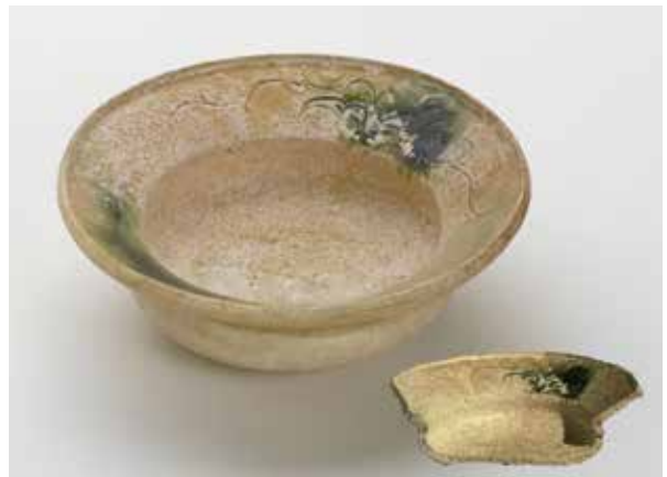
黄瀬戸鉢 (中京区三条通麩屋町東入弁慶石町出土)

発掘調査では、遺跡から様々な遺物が出土します。そしてこれらは、過去の暮らしや文化を知る大きな手がかりとなります。しかし、土器をはじめとして、遺物はその大半がバラバラの破片の状態が出土します。そこでそれらを接合し、石膏などで不足している部分を補うなどの作業を行ない、土器を復元します。色づけは、この復元作業の最後の段階です。