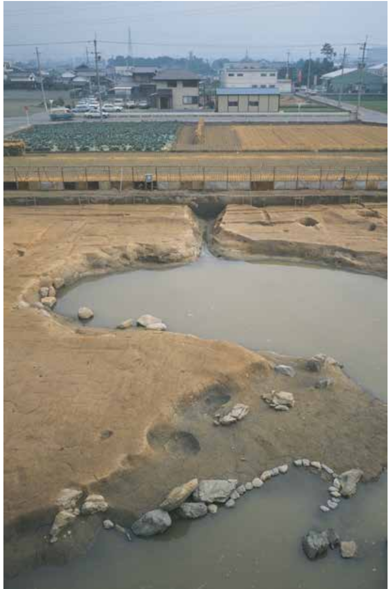
鳥羽離宮金剛心院の池跡