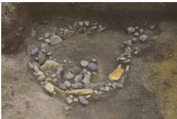
右京三条二坊八町の池跡

京域内の池の水は、導水溝による場合や池底からの湧き水などを利用していた。あるいは史料にあるように、泉などの湧き水を池に引く場合もあったのであろう。自然の池や泉を利用した池の水は、季節の変化に左右されやすかったものと思われる。当時の貴族は、四季のこうした変化を楽しんでいたであろう。（鈴木久男）