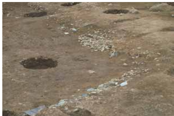
高陽院の池の洲浜