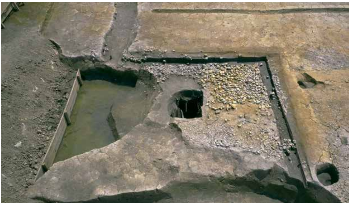
川原寺の井戸跡 方形の井戸のまわりには礫が敷きつめられ、板組の溝によって区画される。

長岡京に関係すると思われる寺は七つあることが、『続日本紀』延暦九年(790)の記事でわかる。しかしこの七寺についてはいまだ明らかとなっていない。文献史料から知ることのできる寺院名としては、『類聚国史』大同五年(810)の記事に、川原寺と長岡寺の二つがみえるのみである。長岡京内で現在知られている寺院は5遺跡あるが、このうち文献史料に記載された寺院名と実際に残る地名とが一致するのは川原寺のみである。他の寺院が当時どのような名前と呼ばれていたのか、また長岡寺(乙訓寺か)がどの寺を指しているのかなど問題は数多く残されている。川原寺を除く他の4遺跡はいずれ