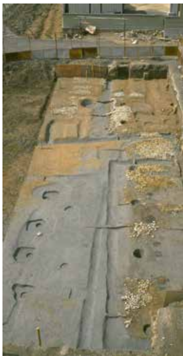
竈屋と思われる建物跡 点々と焼土が並ぶ。

で出土した瓦数も少なく、寺院には瓦という通説には合わないが、「井」・「旨」銘軒瓦などの長岡京期の瓦が数点みられる。また、掘立柱建物の内外に石敷を広い範囲に施したり、建物内に竈を並べて使用したと思われる痕跡、板組の溝、大路に開く門と橋跡などが検出され、これらはすべて通常の邸宅にはみられない遺構である。遺構は計画的に配置され、また占地関係から寺域の北西部にあたることから、寺の炊事などを行なう竈屋などが並ぶ、大衆院関連の遺構群と推定される。出土した遺物の中には、土器に「王」・「東」・「大」・「本」などの墨書したものが多くみられ、また木簡の出土数が目立つこと、木沓や漆紙文書など特異なものがみられることから、この区域に寺跡が想定できる状況にある。