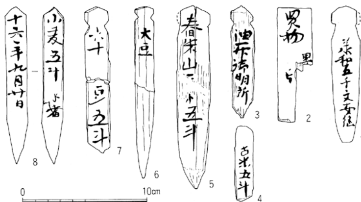
西市と周辺出土の木簡

家が密集していることなどから発掘調査の件数は少なく、そのため市町を復元できるような遺構の発見はこれまでのところあまりありません。しかし、西市外町を中心に市内を区画する溝や柱穴などが検出されており、徐々に外町の様相が明らかになってきました。それによると、板・杭などの木材で雑に護岸した溝で狭い区画を造りだしています。市塵の様子はわかりませんが、西市外町の狭い区画から想像すると、台の上に商品を並べた東西の市は、今の「弘法さん」のような賑わいをみせていたのかもしれない。（菅田 薫）