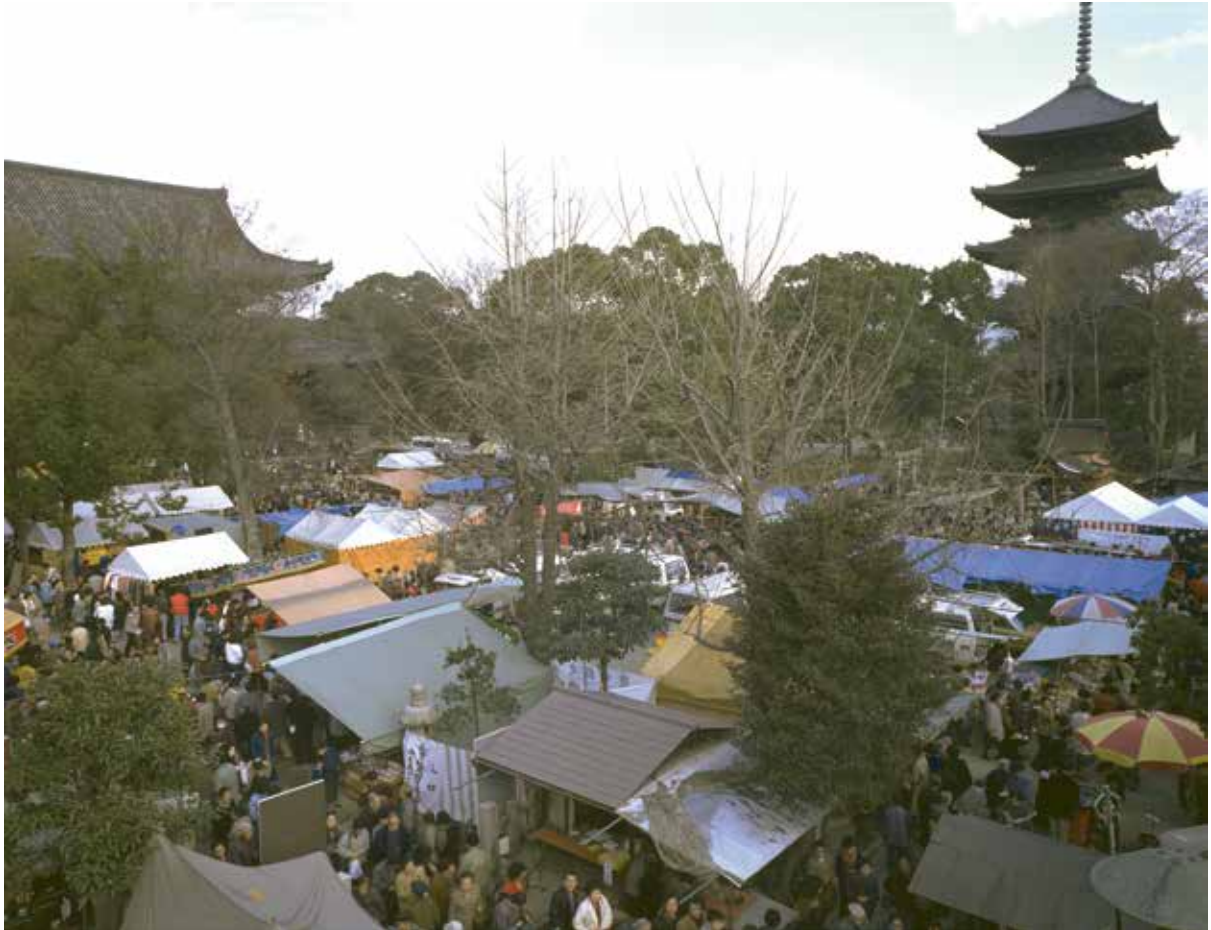
東寺弘法市の賑わい 弘法市は毎月 21 日に開かれ、多種の商品が並べられます。

平安京の東西市は市司 いち いちのつかさ によって管理運営された官営の市です。平安時代の法令書である『延喜式』には市の管理・運営・維持など細かく規定されています。東市は毎月 15 日まで、西市は 16 日以後と規定され、東西の市が交代で開かれていました。また、市で扱う商品もそれぞれ決められており東市五十一 みせ 麩、西市三十三麩に定められていました。そのうち共通する商品を扱う麩は十七麩あります。また、市内 いちない の道路・溝、中を流れ