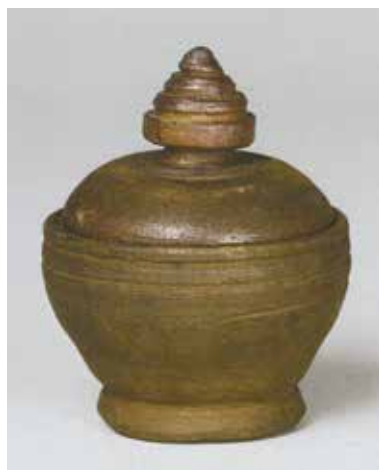
写真2 なんぼんほうしゅちゆうこうごう 南蛮宝珠鈕香合 (全高7.4cm 胴径5.9cm)

宝珠形つまみが似ているのが写真2の香合です。この蓋つまみには段があり、つまみも大きく、近似しています。身にも陶片の蓋と同様に刃の鋭い工具による三本の筋が巡っています。紹介したこの二例の焼きしめ陶器は茶の湯の世界では「 なんぼん 南蛮・ しまもの 島物」と呼称され、南海の陶磁の総称として使用されています。