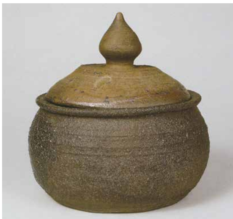
写真1 なんぼんしめきりみずさし 南蛮切水指 (全高15.7cm 胴径16.9cm)

遺物は過去を語るることによって時間を越えて現代と過去を結ぶ役目をします。また遺物は空間を越えて場所と場所を結ぶ役目もします。陶片を見つけることも重要ですが、それに加えてこのような歴史の認識に達することに、私たちは興味をおぼえています。たった一片の陶片によって歴史がわかることもあるのです。