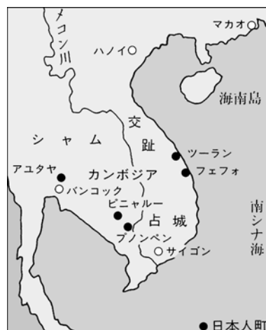
日本人町所在地 (17世紀)

最近、堺や博多、大阪など各地でベトナムやタイの陶磁が出土しています。代表的なものに長胴の壺があり、茶道具でもこれに近似したものがみられ、なかに「 なんぼん 南蛮 すいぎんつぼはないれ 水銀壺花入」という名称をもつものがあります。これらの長胴壺はベトナムの窯址周辺やベトナム中部域の採集品に同様のものが見られます。紹介した陶片も作りや胎土がベトナムで採集された陶片と