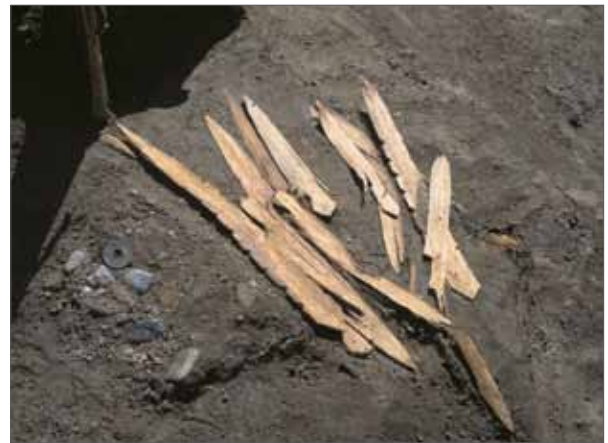
3 平安京右京八条二坊 下京区西七条石井町(七条小学校) 水や穢れ・病の侵入を防ぐために祀られた齋串と和銅開珎(平安時代初頭)。