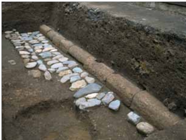
4 平安宮内裏跡 上京区下立売通千本東入田中町 造當時の内裏内郭回廊、基壇と雨落溝(北東から)。