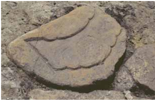
8 平安京左京八条三坊 下京区東塩小路町（JR 京都駅構内）

写真右 調査地中央の白い部分が室町小路、小路をはさんで中世の町屋が展開している（北西から）。