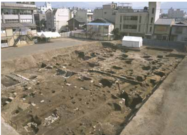
9 平安京左京二条四坊跡 中京区柳馬場竹屋町下る五丁目（御所南小学校）

江戸時代中期の町屋跡、礎石建物、蔵、背割り溝などの遺構から当時の町屋割りがよくわかる（南西から）。