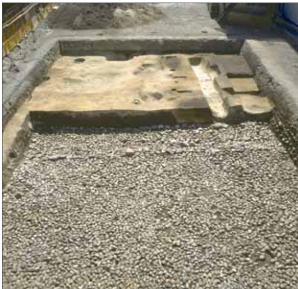
6 白河街区跡 左京区聖護院 えんとみ 岡頓美町