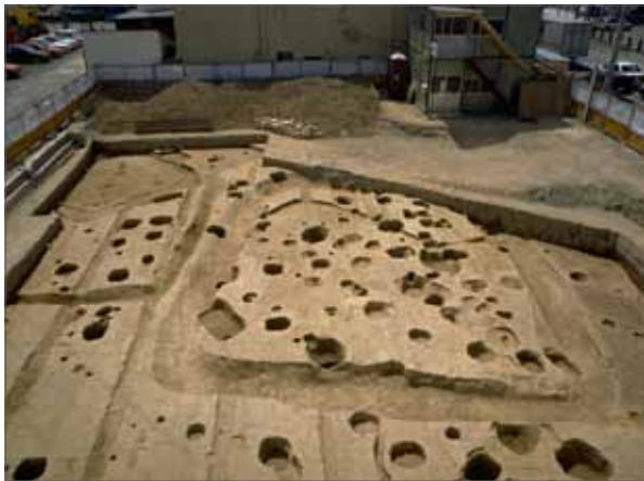
2 平安京右京五条四坊(西京極遺跡) 右京区西院月双町 弥生時代後半の住居跡と、その後造られた方形周溝墓(東から)。