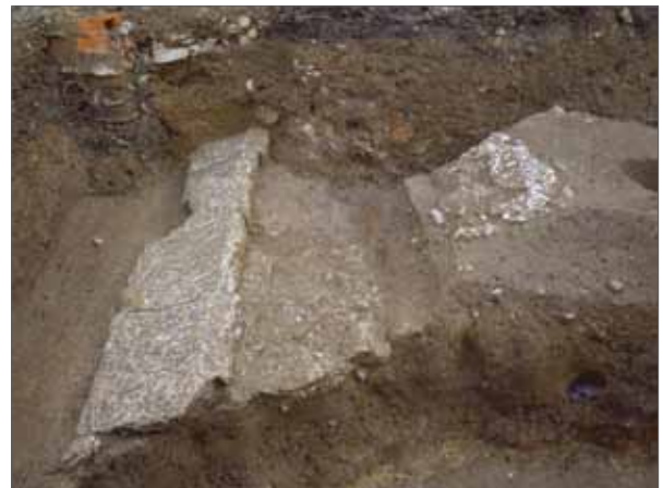
5 平安宮朝堂院跡 上京区竹屋町通千本東入主税町 朝堂院東面、宣政門の階段の一部(北東から)。