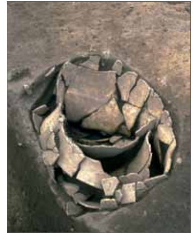
1 中臣遺跡 山科区栗栖野中臣町 縄文時代晩期の埋甕(墓)。

今回はこれらの調査成果を写真で振り返ってみたいと思います。紹介するのはごく一部ですが、建都以前も含めて各時代の「京都」を垣間 かいま みることのできるようなものを選びました。あらためて京都の歴史の重みを感じていただけることでしょう。