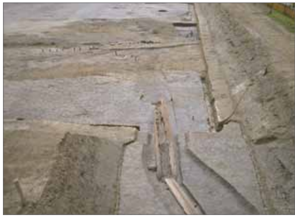
7 水垂遺跡 伏見区淀水垂町 みずたれ ・樋爪町 ひづめ

写真上 磬の鋳型出土状況。町屋の中に銅細工の工房があり炉床に磬の鋳型を転用している。