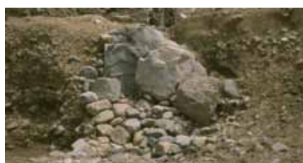
写真6 左京三条三坊十三町の庭園遺構