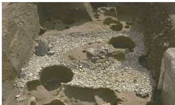
写真2 左京四条三坊九町の庭園遺構

京城の東で南北方向の高み（尾根）があり、そこから朱雀大路あたりにかけてかなり傾斜していることが読み取れます。実際に発掘してみるとこの高みにも、細かい流路や浅い谷筋があることがわかります。基盤の目からくる平坦なイメージとは別に、平安京造営当初には現在よりもっと起伏に富んだ地形であったことが想像できます。（図中の○囲み数字は写真番号と対応する）