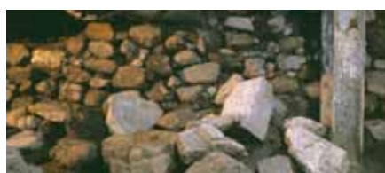
写真7 旧二条城の石垣