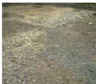
写真3 高陽院の庭園遺構