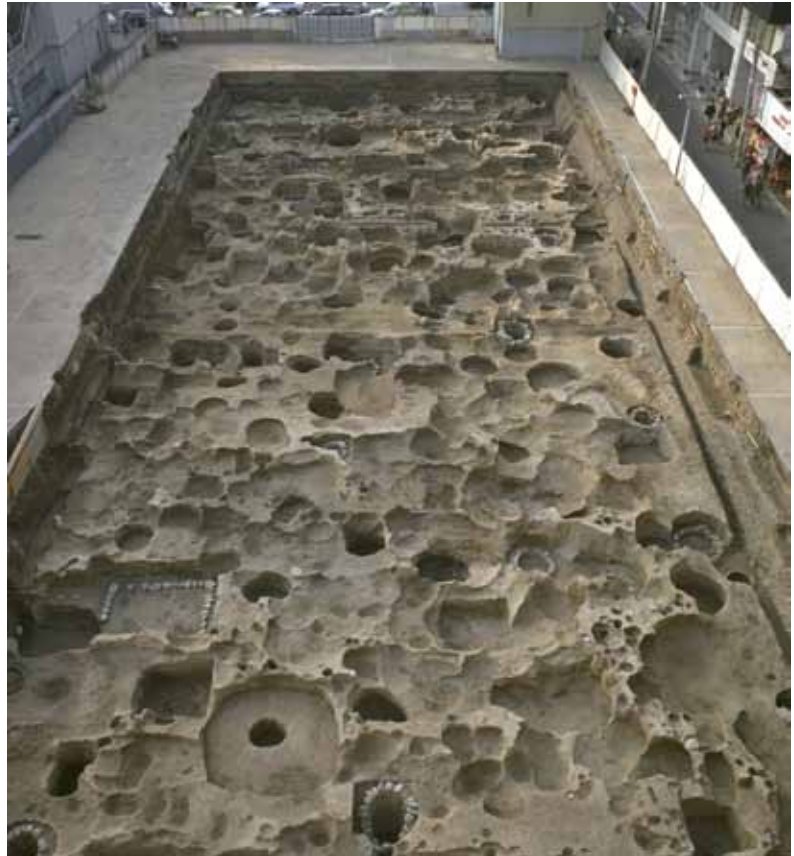
写真1 左京四条三坊十三町の調査（東から）

1989年に烏丸錦小路を下がった東側（左京四条三坊十三町）の調査で検出された平安時代の遺構面