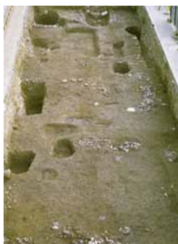
写真5 東本願寺前の中世古墓群

左京の調査においては、京都が1200年にわたり人が住み続けてきた都市であり、とりわけ下京ではそうした連続性のある地域だといふことが意識されなければなりません。1200年の歴史をそのまま考古資料として手に入れるチャンスなのですから…。（上村憲章）