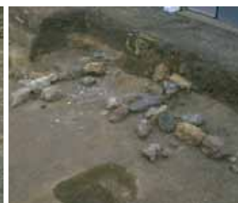
写真4 堀河院の庭園遺構

町としての活力の象徴であるといえます。結果的に地表面を2m近くも押し上げた原因も、このあたりにあるように思われます。