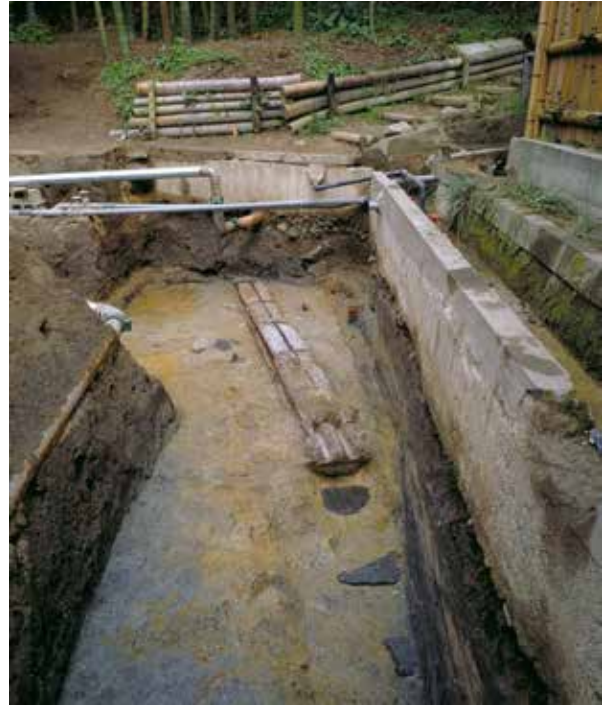
石製導水施設（西から）

辺1.2 mある。石垣といえば、安土桃山時代の城郭に盛んに用いられ始めるが、この石垣は、これに先立つこと約半世紀であり、その系譜が注目される。