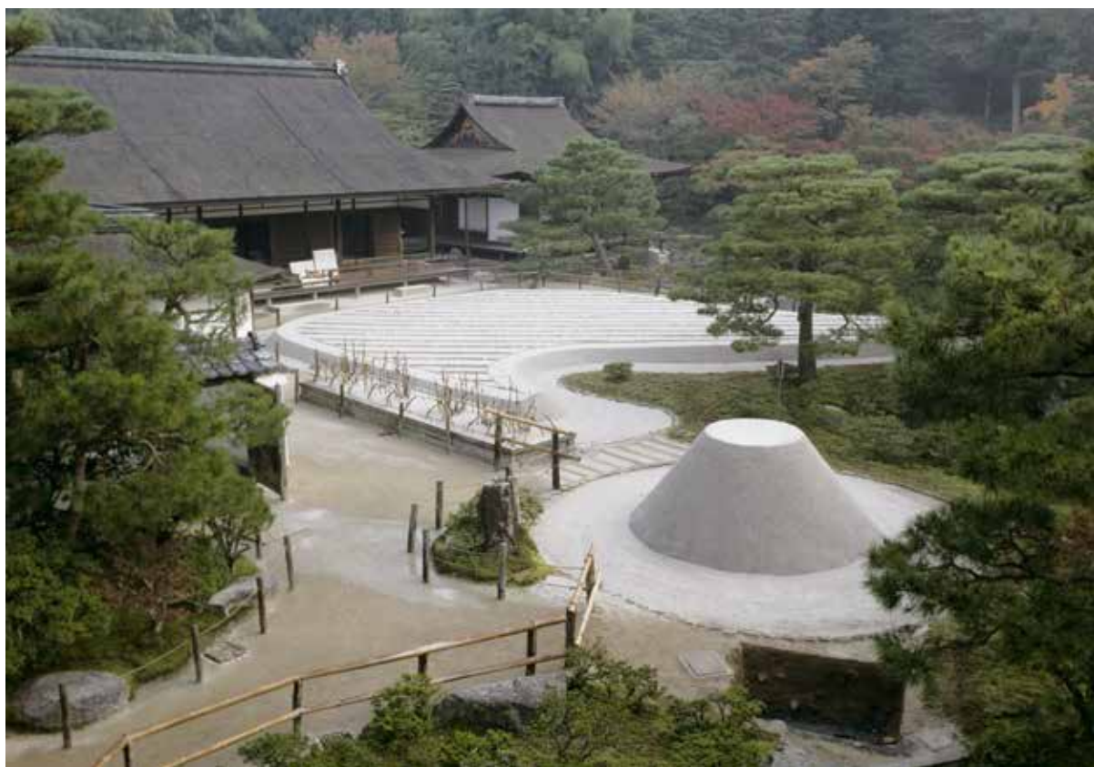
銀閣寺庭園（南西から）中央手前に調査区

文明14年(1482)、足利義政は如意ヶ嶽山麓に山荘の造営を開始した。この山荘が、今も銀閣寺として知られる慈照寺の前身である東山山荘である。義政は、すでに文明5年(1473)将軍職を子の義尚に譲っており、隠居後の別荘として山荘の造営を計画した。