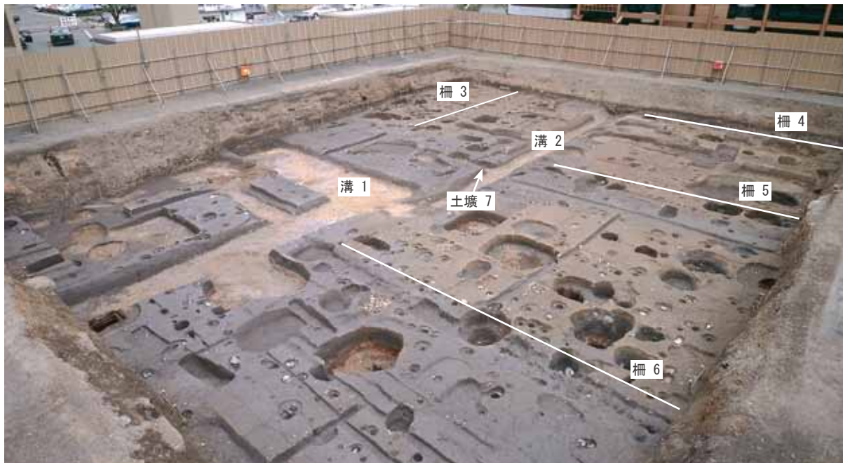
写真1 調査地のようす (南東から)

八条院町 はちじょういんのちょう について 京都駅周辺には、鎌倉時代後期から室町時代前期にかけて、八条院町と呼ばれる町がありました。この町は、平安時代後期に造られた八条院 あき 障子内親王(鳥羽天皇の娘)の御所跡にできたもので、正和二年(1313)後宇多法皇により東寺に寄進され、荘園となりました。そこには東寺で働く人をはじめ、さまざまな職業の人々が住み、いろいろな店もあり、商工業を中心として栄えていました。