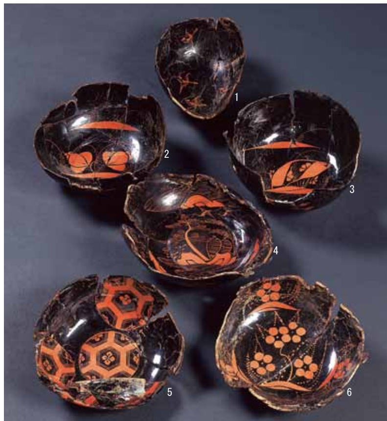
写真2 発見された漆器椀

椀は大半が内外面黒漆塗のもので、内面赤色で外面黒色、両面赤色で高台だけ黒色のものもあり、