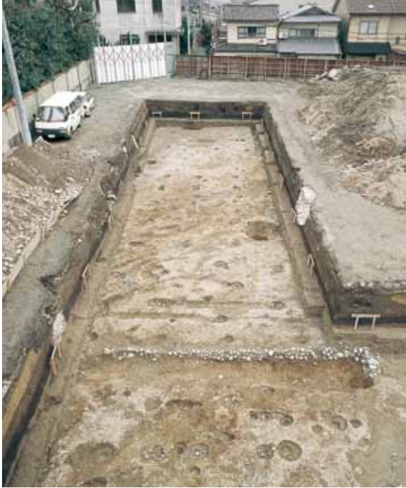
写真1 石を積んだ溝と屋敷跡 (北から)