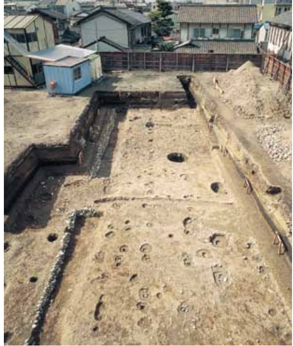
写真2 石を積んだ溝と2列の防御柵 (東から)

1996年11月から翌年3月にかけて行なった京都大学西部構内遺跡(左京区吉田泉殿町)の発掘調査で、平安時代後期の屋敷跡が見つかりました。平安京の北東部、鴨川を東に越えた地点です。この屋敷跡は、出土した土器から12世紀後半に造られたとみられ、豪華な邸宅とも庶民の家とも異なる風変わりなものでした。