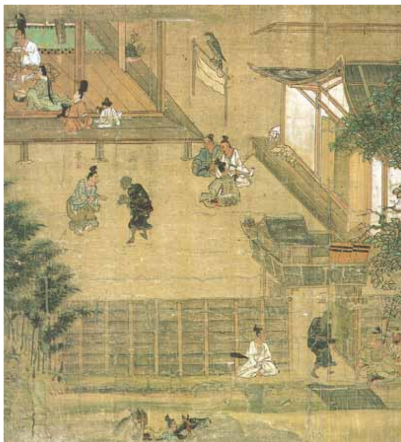
『一遍上人絵伝』に描かれた地方武士の屋敷 鎌倉時代後半の製作。溝と板塀に囲まれた簡素な住宅で主人が飲食している。