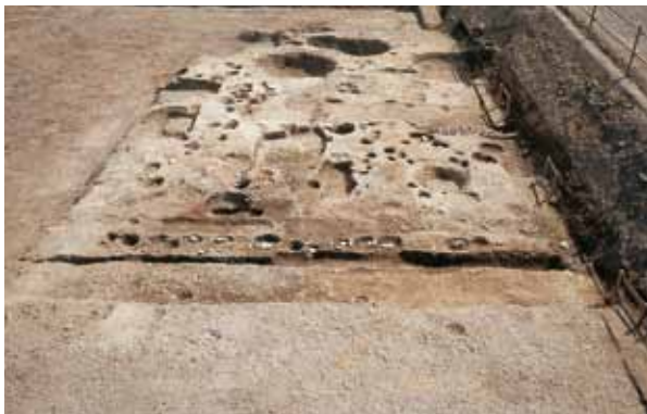
9 八条坊門小路と鑄造工房 下京区油小路通塩小路下る南不動堂町 八条坊門小路の南北で、鑄造に関する炉や井戸、作業場を検出した。坩堝や鑄型も多数出土した。（北から）