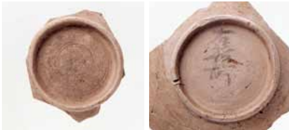
6 平安京右京三条一坊三町出土の墨書土器 中京区西ノ京梅尾町 土器に書かれていた文字から、右京職の中に「計帳所」「右籍所」などが置かれていたことがわかった。