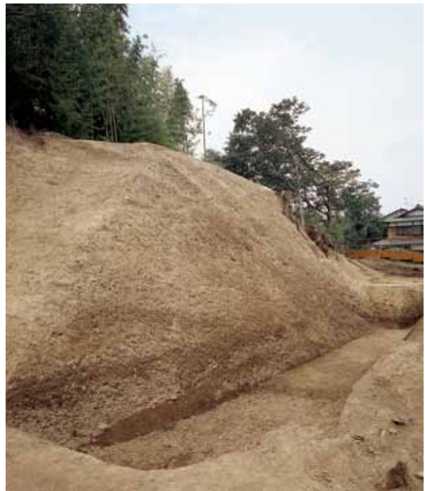
11 山科本願寺を囲んでいた土塁の断面 山科区西野左義長町 粘質土と礫混じりの土を交互に積み上げて造ったことがわかった。土塁基底部の幅は 15 m、高さは 6 m ある。（南東から）