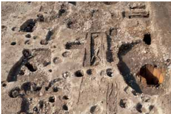
10 室町時代前期の共同墓地 下京区油小路通塩小路下る東油小路町 八条院町の西はずれで発見した木棺墓群で墓域の北端は写真 9 の調査区に及ぶ。骨髄炎で肥大した人骨も残存。（東から）