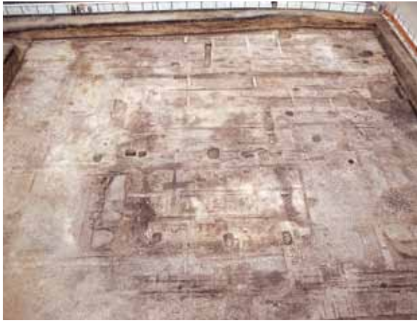
5 平安京右京三条一坊三町の建物跡 中京区西ノ京梅尾町 JR 二条駅構内で右京職（右京を管轄する役所）に関係すると考えられる建物跡を発見。墨書土器や硯などが出土。（西から）