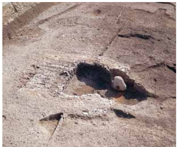
4 安井西裏瓦窯跡 右京区太秦安井西裏町

平安時代前期の官窯の一つ。窯は燃焼室と焼成室に分かれていて、間を隔壁で仕切っていた。(北東から)