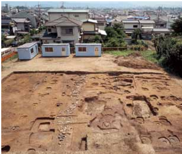
1 檜原廃寺 西京区檜原内垣外町

白鳳時代の創建であるが、長岡京遷都の時に改修されたと見られる回廊跡と掘立柱建物跡を発見した。(西から)