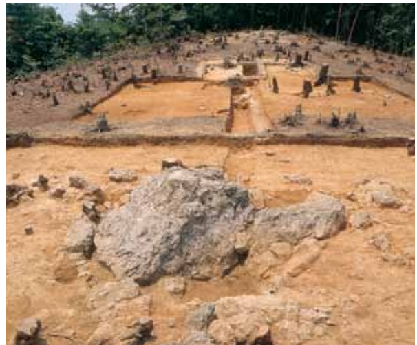
2 梅ヶ畑祭祀遺跡 右京区梅ヶ畑向ノ地町

白鳳時代の創建であるが、長岡京遷都の時に改修されたと見られる回廊跡と掘立柱建物跡を発見した。(西から)