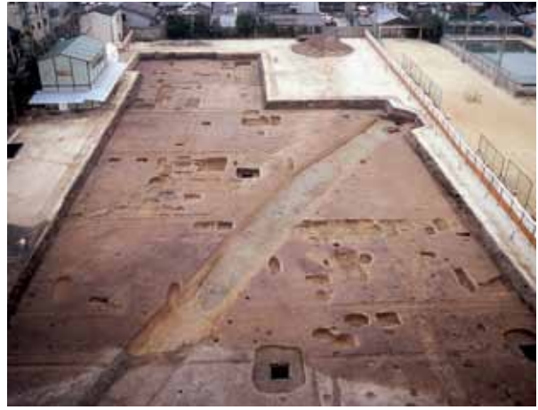
7 平安京右京七条一坊十四町 下京区西七条御領町 七条中学校の調査で平安時代前期の掘立柱建物跡や井戸を発見。西市の外町にあたるが宅地利用されていた。（東から）