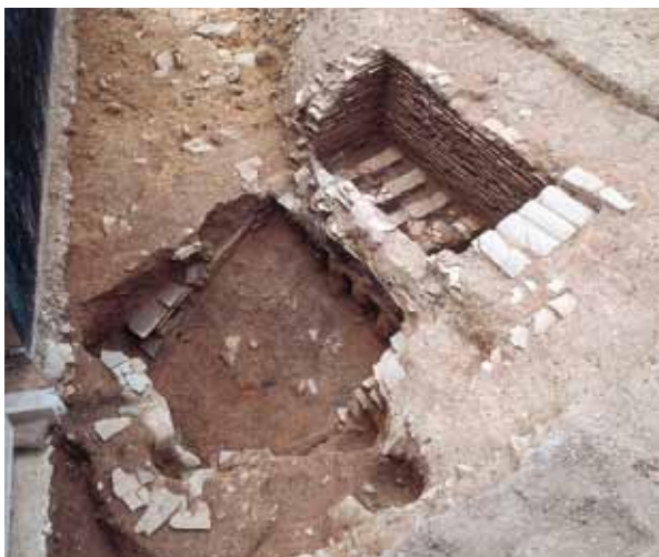
3 上ノ庄田瓦窯跡 北区西賀茂上庄田町

丘陵頂部のような様子。写真手前の岩の周辺から平安時代前期の土師器や須恵器と共に銅銭が出土した。(北東から)