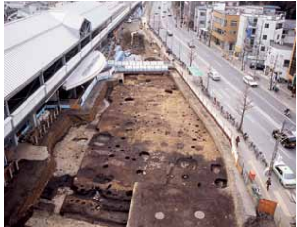
8 法金剛院旧境内 右京区花園扇野町 JR 花園駅前広場で、法金剛院東御所の建物跡や中門廊・遣水・池の岸などを確認。西京極大路の路面も発見した。（東から）