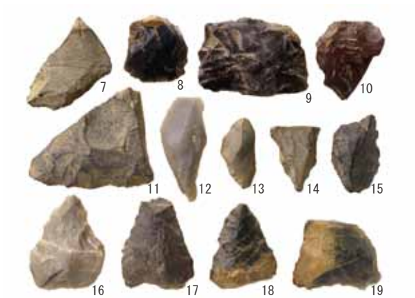
写真4 縄文時代の石匙・石錐など