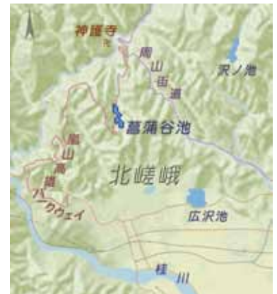
図1 菖蒲谷池の位置