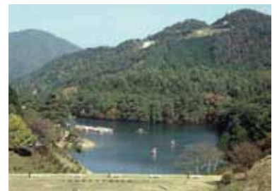
写真2 現在の菖蒲谷池(南から)

この2点の石器は1970年『古代文化』第22巻6号誌上で四手井晴子氏によって紹介され、同年秋発行の『京都の歴史』第1巻で「京都盆地とその周辺部は、(中略)全国でも数少ない先土器時代遺跡の空白地帯であった。したがって菖蒲谷池畔での発見は、遺物分布の空白地帯を埋め、しかもそれまで縄文時代にはじまると考えられてきた京都の歴史を、一挙に数万年以前にまでさかのぼらせる快挙だったのである。」と書かれています。