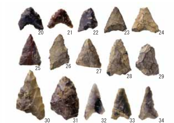
写真5 縄文時代の石鋸

採集された石器 菖蒲谷池遺跡からは、平安時代の土器類も採集されていますが、採集品の大半は石器類です。石器は、池中央部西側の南北約30mに限られた範囲から採集されています。採集品には 註2 石鋸、 註3 石錐、 註4 スクレイパー・ 註5 石匙、ナイフ形石器、剥片・石核などがあります。今回すでに紹介されている2点のナイフ形石器以外に採集されていた石器を紹介します。