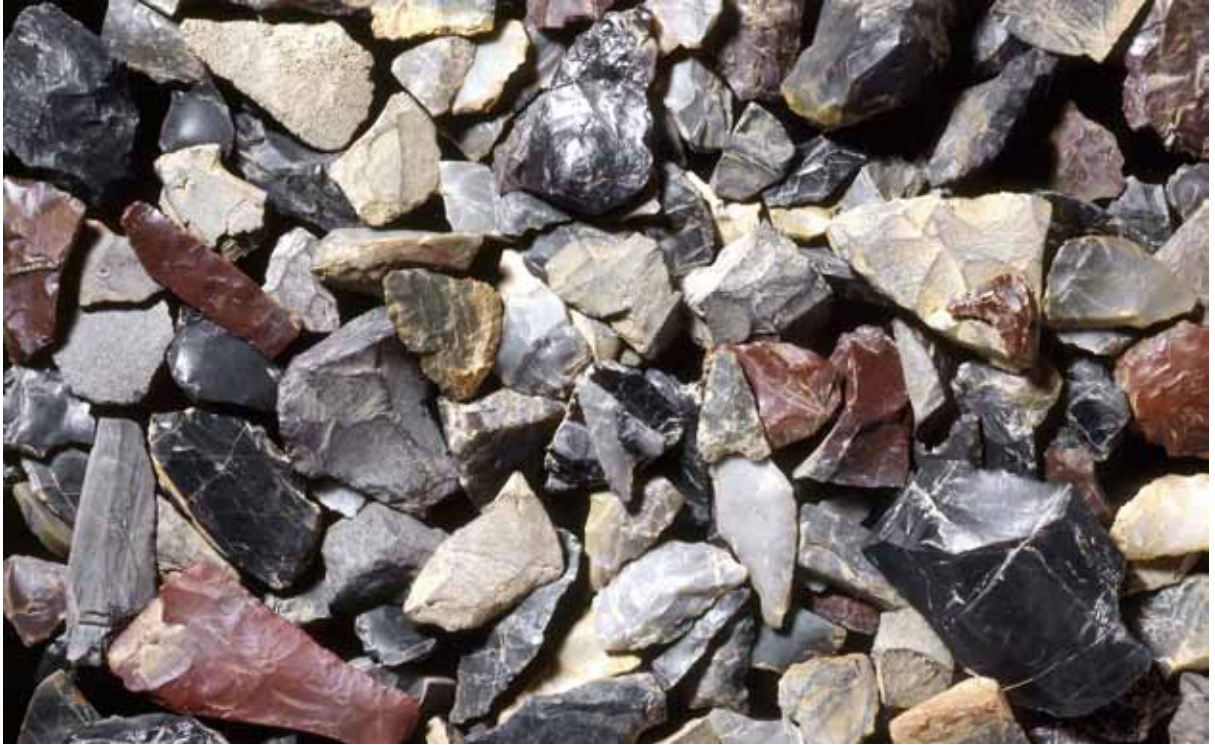
写真1 菖蒲谷池で採集した石器

菖蒲谷池は、京都市右京区梅ヶ畑 しょうぶだに にあり、嵯峨野から北に約2km、標高230mほどの鞍部を越えた山間地にあります。清滝川に合流する北向きの谷をせき止めてつくられた溜池 ためいけ です。現在の菖蒲谷池は、西側に嵐山高雄パークウェイが走り、池の中央部西側にレジャーのための施設があります。周辺はゆるやかな傾斜の渚で、他の場所は水面近くまで山地が迫っています。