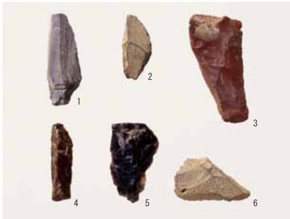
写真3 先土器時代の石器