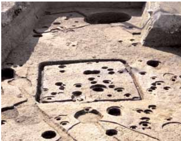
写真4 1999年の調査 古墳時代後期の竪穴住居跡