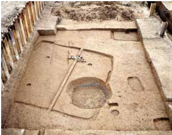
写真2 1996年の調査 奈良時代の竪穴住居跡