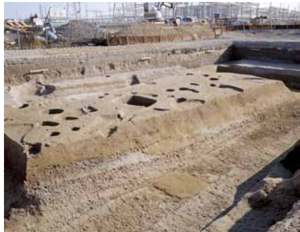
写真3 1998年の調査 中世以前の断面観察