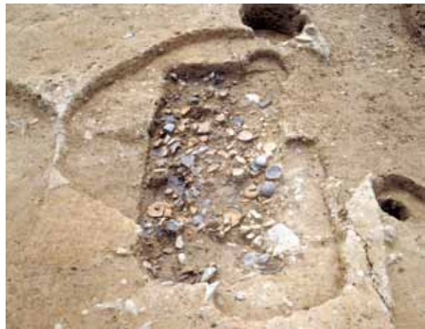
写真5 1999年の調査 鎌倉時代後半の土壙墓

1996年の調査 奈良時代の竪穴住居跡（写真2）や、鎌倉時代の建物跡・井戸・溝などを発見しました。柱穴のひとつからは、地鎮に使われたと思われる銭貨が出土しました。