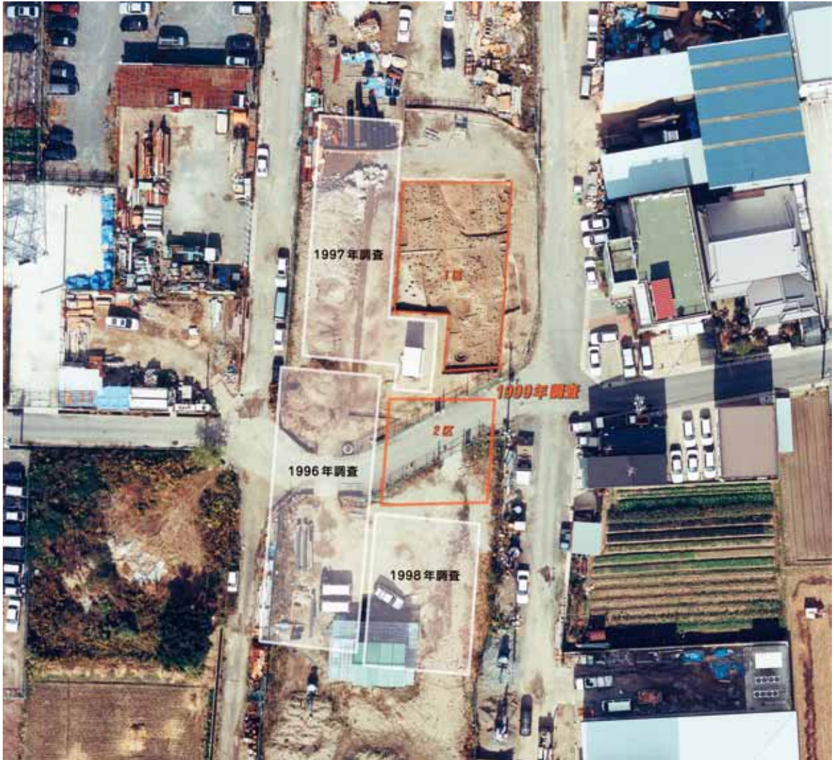
写真1 上空から見た調査区 (写真上が北)

はじめに しもみす 下三栖付近は今、最も変わりつつある地域のひとつです。1993年より油小路通の延長にともなって工事が始まりました。