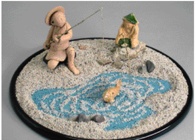
太公望の人形と盆景

ますと、竿には釣り糸が必要です。置くべき場所には川沼・池、石や岩といった情景がいりますし、水中には魚も必要です。そうしてできあがったのが、丸盆にセットした写真です。ミニチュアの土人形を使った、一種の盆景ですが、江戸時代のお公家さんやお姫さんの遊びの一つになっていたのではないのでしょうか。床や棚の飾りとしても使えそうです。