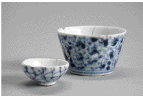
土人形とさまざまなミニチュアの食器