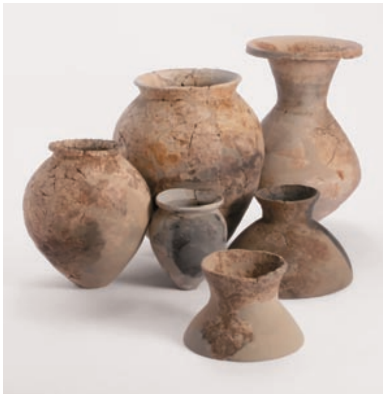
写真3 出土した弥生土器