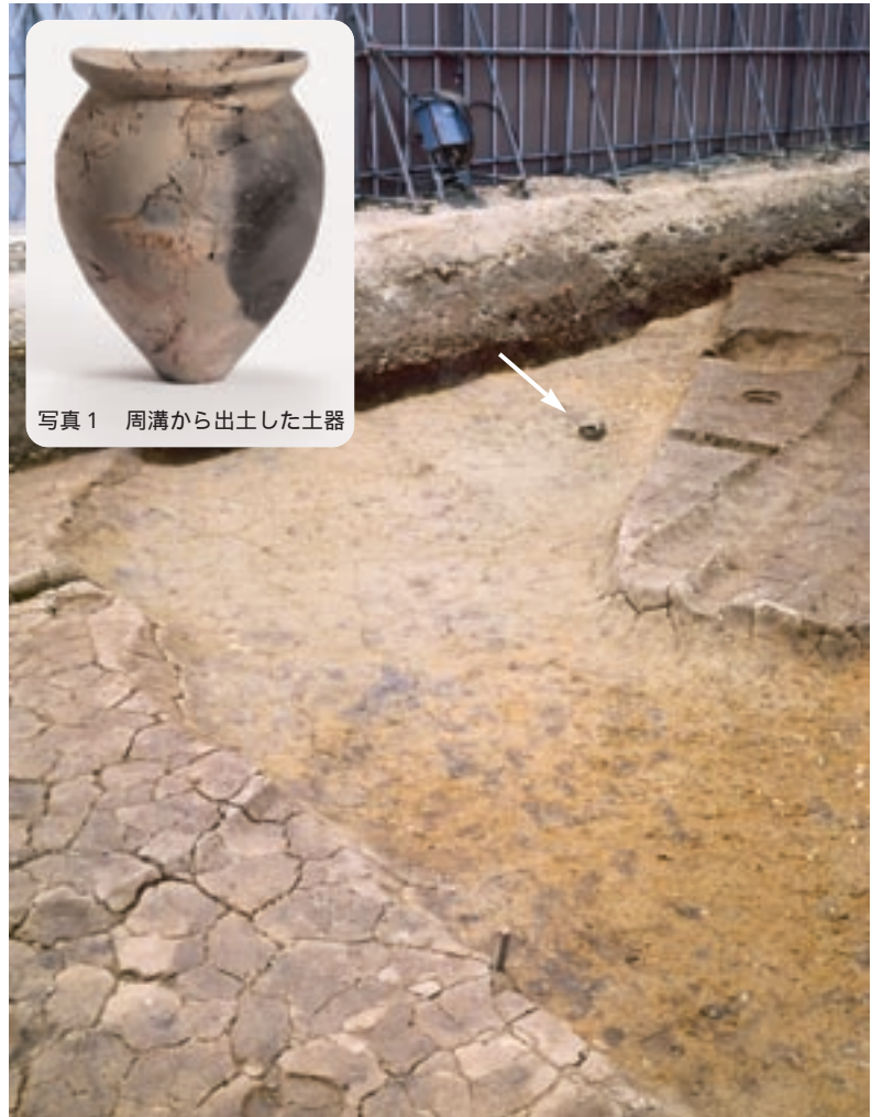
写真1 周溝から出土した土器

見つかった方形周溝墓は、弥生時代中期前半(紀元前2世紀)から後期後半(3世紀)にかけて築かれています。同じ場所に、これほど長く方形周溝墓が築かれてい