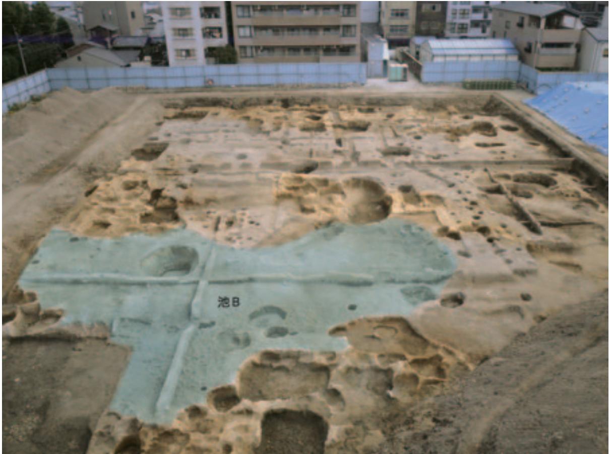
池B (西から) 池Aは掘削前。

はじめに 次に紹介する池は、調査区の北西部で見つかった三日月形を呈した池Bです。東西約15m、南北約26mあり、調査では池の全体が判明しました。