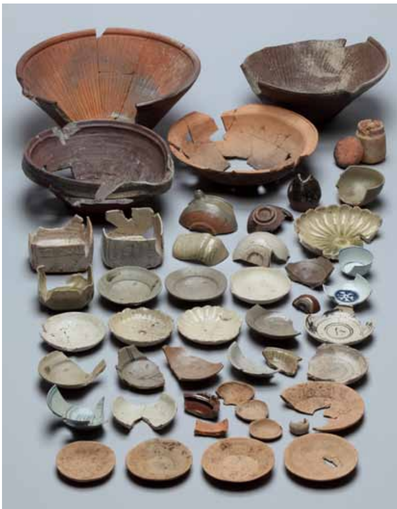
写真1 江戸時代初期の土坑から出土した土器類