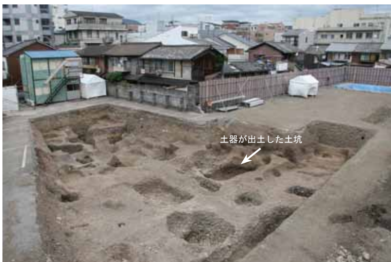
写真2 江戸時代初期の遺構（1区 南東から）