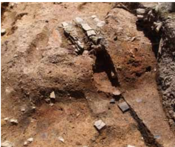
7 特別史跡・特別名勝 鹿苑寺(金閣寺)庭園 北区金閣寺町

古墳時代から江戸時代までの遺構・遺物を検出した。室町時代では風呂の遺構があり、出土遺物から寺院が存在したことが推定できた。史料にみえる「五条寺」との関連性が注目される。