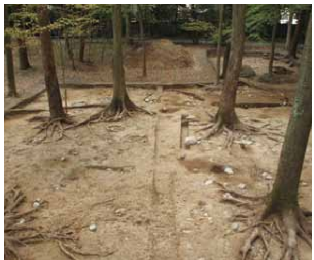
8 史跡賀茂御祖神社(下鴨神社)境内 左京区下鴨泉川町

丘陵裾部で室町時代の平窯を検出した。窯は3基見つかっており、そのうちの1基は、ロストル(瓦を置く台)の最下段が残存する。小規模であるが、北山殿の所用瓦を焼成したとみられる。