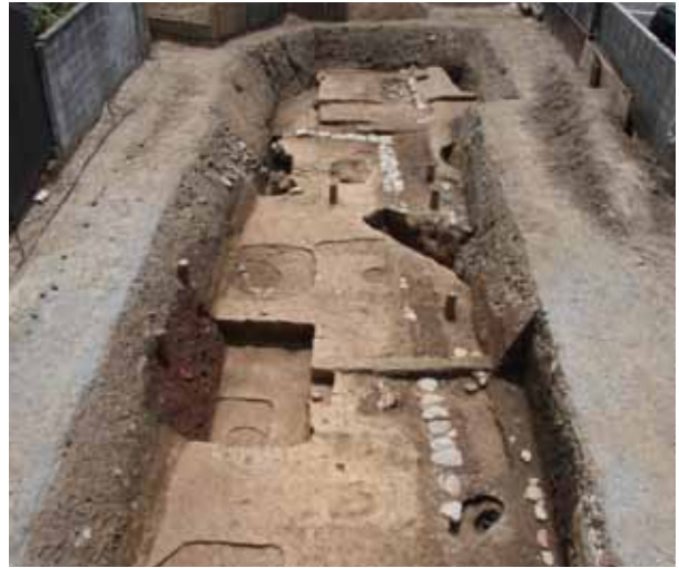
4 平安宮内裏跡(弘徽殿・登華殿) 上京区出水通土屋町東入東神明町

古墳時代後期の前方後円墳。後円部の中央で横穴式石室を検出した。石室の形態と出土遺物から、乙訓最古の横穴式石室とみられる。石室の入口から4基の円筒埴輪が出土した。