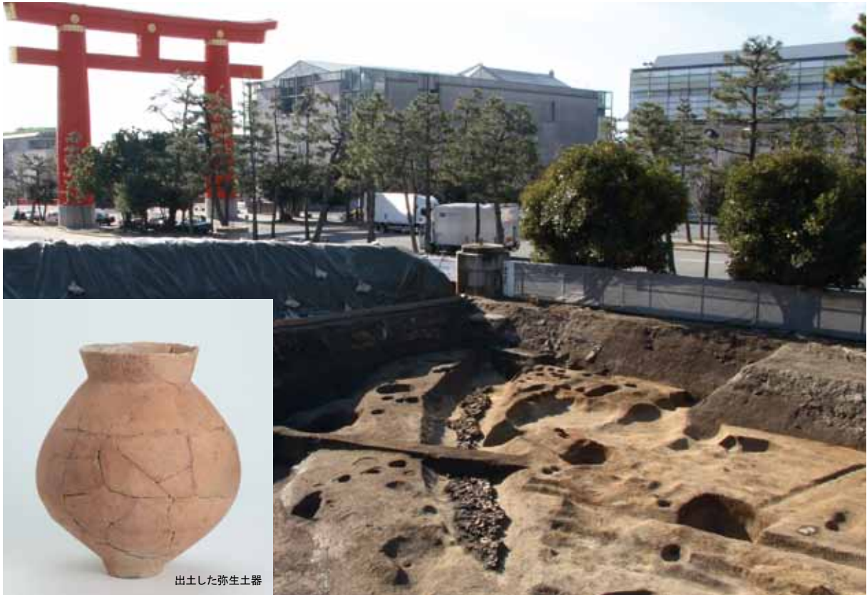
出土した弥生土器