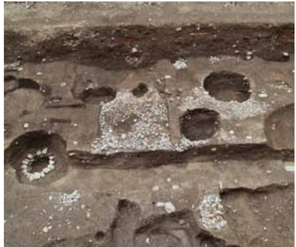
6 平安京左京五条三坊十町跡・烏丸綾小路遺跡 下京区綾小路烏丸西入童侍者町

平安時代中期の井戸から出土した木簡には「なにはつ」の歌の全文が仮名文字で記されていた。仮名の成立と展開を知る上で重要な資料となった。左は赤外線写真と釈文。