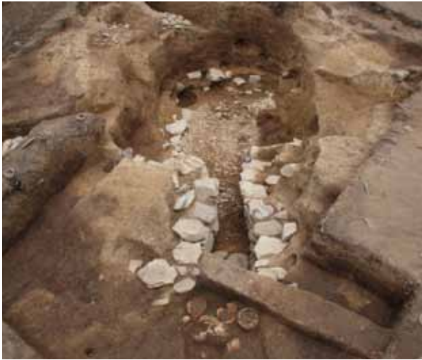
3 芝1号墳 西京区大原野石見町

古墳時代後期の前方後円墳。後円部の中央で横穴式石室を検出した。石室の形態と出土遺物から、乙訓最古の横穴式石室とみられる。石室の入口から4基の円筒埴輪が出土した。