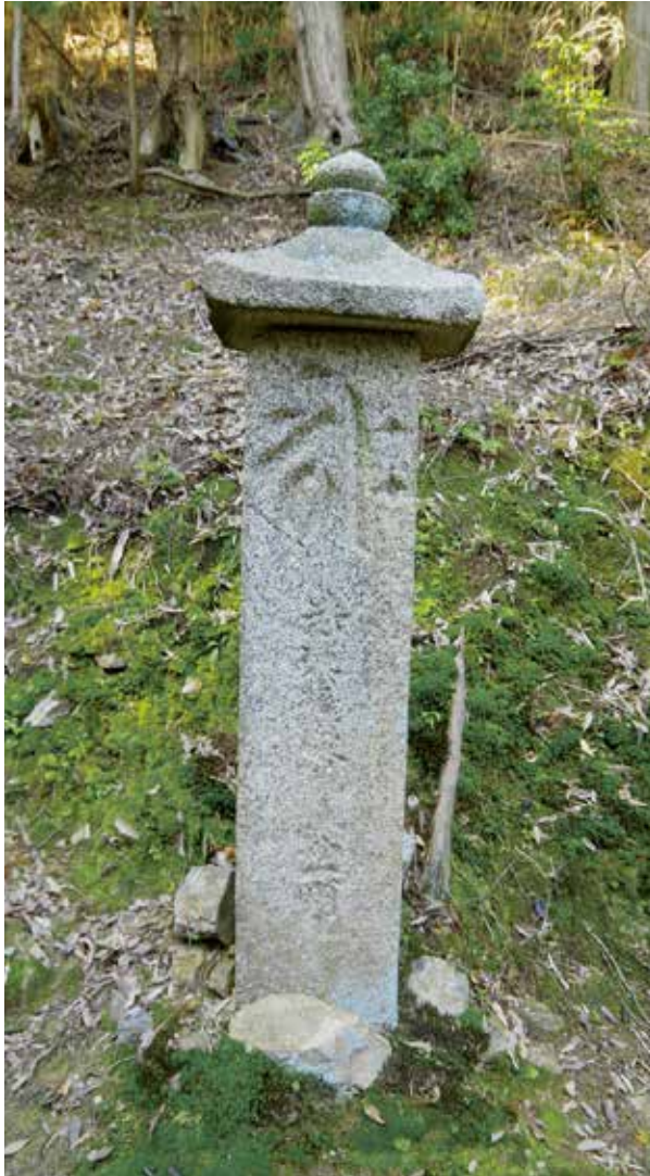
醍醐寺三十一町石

鎌倉時代に建てられた町石のうち、唯一完全な形で残っているものです。このような、方柱と笠からなる石造物を「笠塔婆」と呼びます。笠が力強く反ることが、鎌倉時代の町石の特徴です。