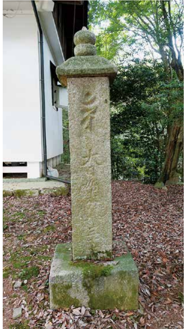
醍醐寺三十七町石

鎌倉時代に建てられた町石のうち、唯一完全な形で残っているものです。このような、方柱と笠からなる石造物を「笠塔婆」と呼びます。笠が力強く反ることが、鎌倉時代の町石の特徴です。