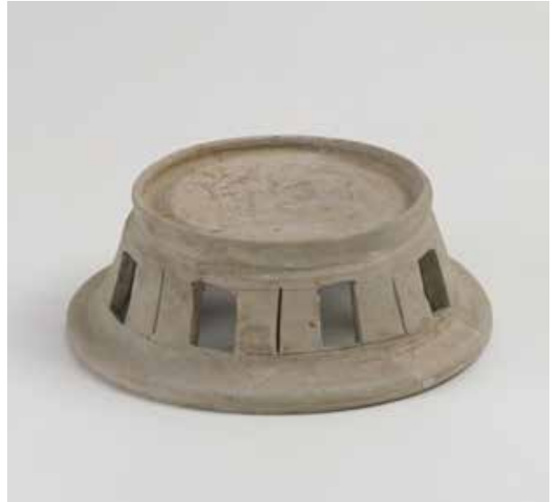
灰釉陶器円面硯 平安京右京二条三坊十五町跡出土

はじめに 令和元年度 京都市考古資料館・京都橘大学文学部歴史遺産学科考古学コース 合同企画展では「焼き物からよむ平安時代—発掘でみえてきた食器・酒造り・饗宴—」と題して、平安時代の焼き物を展示しました。このうち饗宴にスポットライトを当てたブースでは、文房具の一種である硯を展示しました。