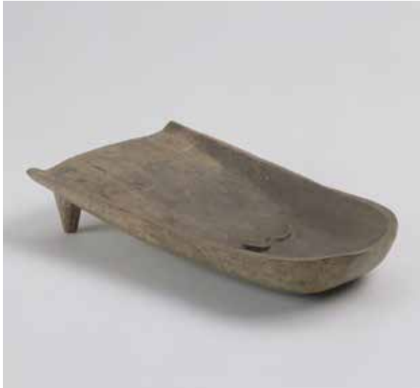
灰釉陶器風字硯 平安宮陰陽寮跡出土