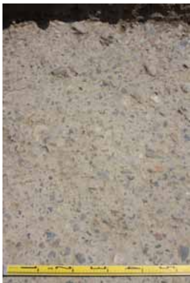
写真2 路面の礫敷き

敷いて路盤とし、その上面の路面は2～3cm程度の礫を密に敷き詰めて固く叩き締めていました。路面に用いられた礫の大きさは均質で、材料を選別し丁寧に造られています(写真2)。また、路の断面形は、中央部が高く、両端に向かって低くなるかまぼこ形をしていました。このことは、降雨の際に雨水を側溝に流し、路面部分に水が溜らないようにするための工夫と考えられます。路面の両側に