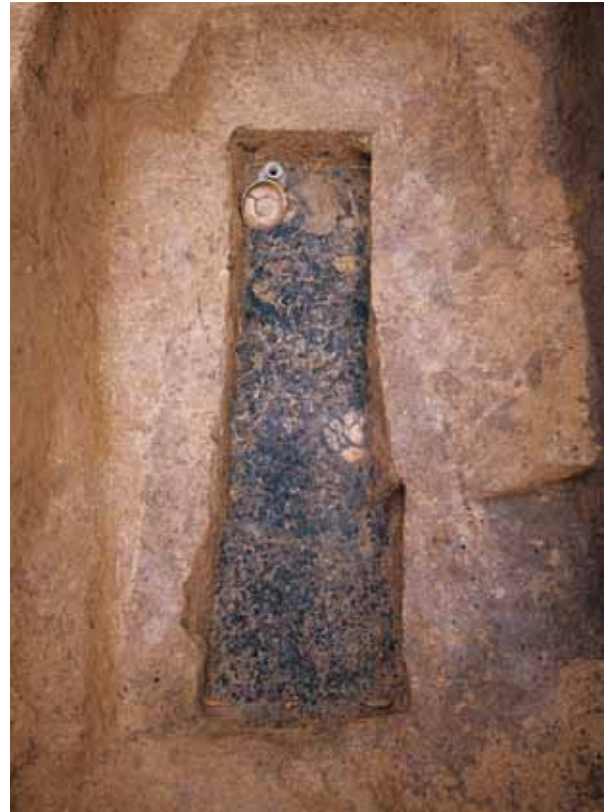
写真2 上ノ段町遺跡で見つかった平安時代の墓 (図1-2)

はじめに 平安時代の都である平安京には、一説によると12万人程度の人々が暮らしていたと考えられています。日々の生活の中で、新しく生まれる命があれば、病気や怪我、天命などによって失われる命もあったことでしょう。大勢の人が暮らしていましたから、毎日のように死者がいたものと思われれます。それでは死者を弔うため、平安時代にはどのような墓を造ったのでしょうか。平安京とその周辺で行なわれた発掘調査で見つかった墓を中心に、その具体的な様相を探っていきしたいと思います。