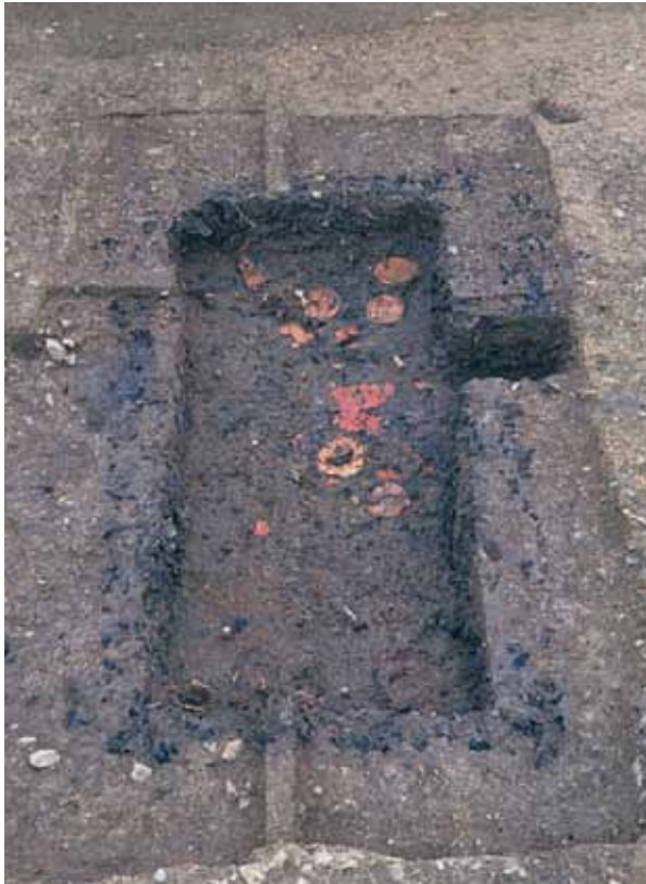
写真1 安祥寺古墓 (図1-1)