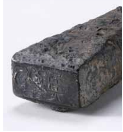
8 御土居跡 下京区中堂寺南町(京都市中央卸売市場) 御土居の堀跡から、慶長丁銀に刻印する極印鑽が出土しました。印面には銀座支配・大黒常是をしめす大黒天の図像と「常是」の文字が刻まれています。