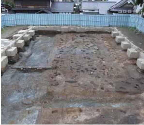
4 平安京右京四条三坊三町跡 右京区西院春日町（西院小学校） 藤原氏の荘園である「小泉庄」に関連すると考えられる大規模な掘立柱建物が見つかりました。道祖大路の西側溝は川のように掘り下げられていました。