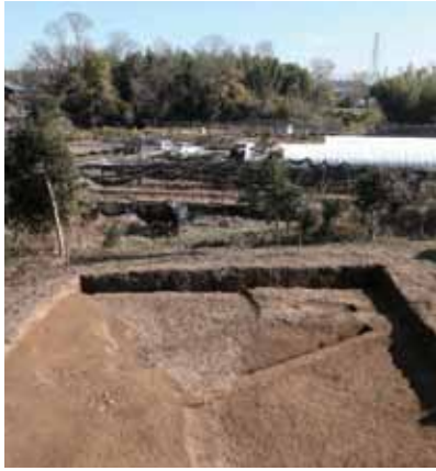
6 石見城跡 西京区大原野石見町 石見城は室町時代の集落に営まれた居館跡です。大きな堀が見つかりました。奥には現存する土塁が見えます。本調査は京都市文化財保護課による範囲確認調査です。