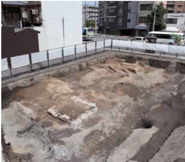
9 御土居跡 下京区河原町通七条下る郷之町 調査地の御土居は江戸時代に付け替えられたものです。東西方向の土塁と外側の溝、さらに高瀬川から貯木場へ引き込む水路が見つかりました。