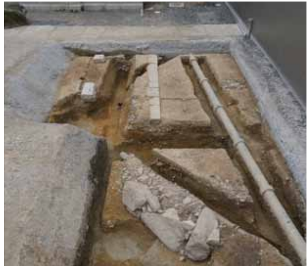
10 方広寺跡 東山区茶屋町（京都市立博物館） 明治古都館北側で、豊臣秀吉が造営した方広寺（東山大仏）南築地塀の寄柱の地覆石や延石が見つかりました。造成工事ともなう足場穴や排水溝も確認しています。