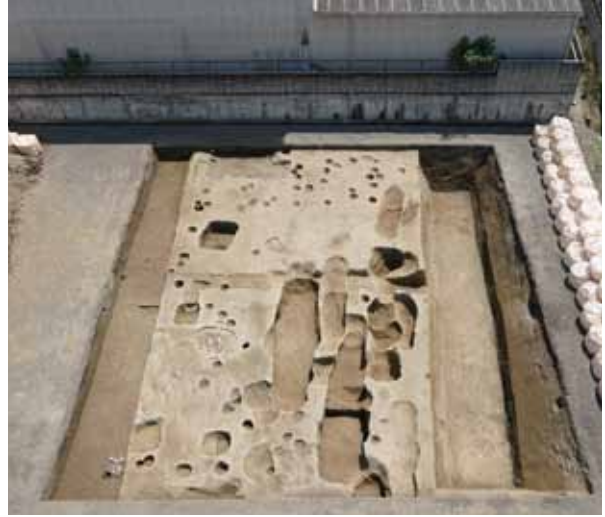
5 山科本願寺跡 山科区西野山階町 中心区画の「御本寺」南部で、東西方向の大きな溝や建物などが見つかりました。山科本願寺の造営過程を知る手掛かりとなりました。