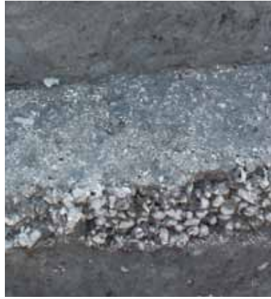
7 富ノ森城跡 伏見区横大路六反畑 集落の内部を区画する溝の埋土には、オオタニシなどの貝殻が一括して廃棄されていました。巨椋池での漁業活動をうかがうことができます。