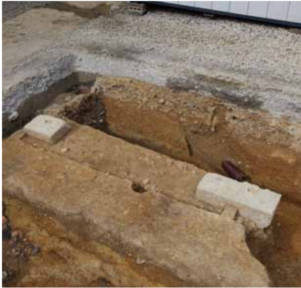
写真1 東山大仏殿（方広寺）築地塀の調査（2021年）