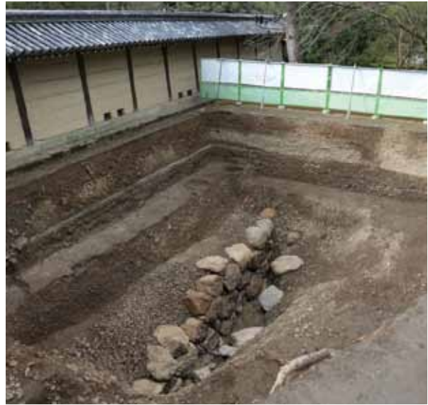
写真2 京都新城石垣・堀の調査（2021年）